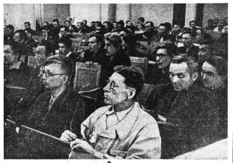
Зураг дээрэ: засэдаини зал соо.

Байша ондо нутагай Советүү- дэй шидэхэе зорилгонууд тушаа зүблөөндэ хабаадагшад тогтоол баталан абаа.