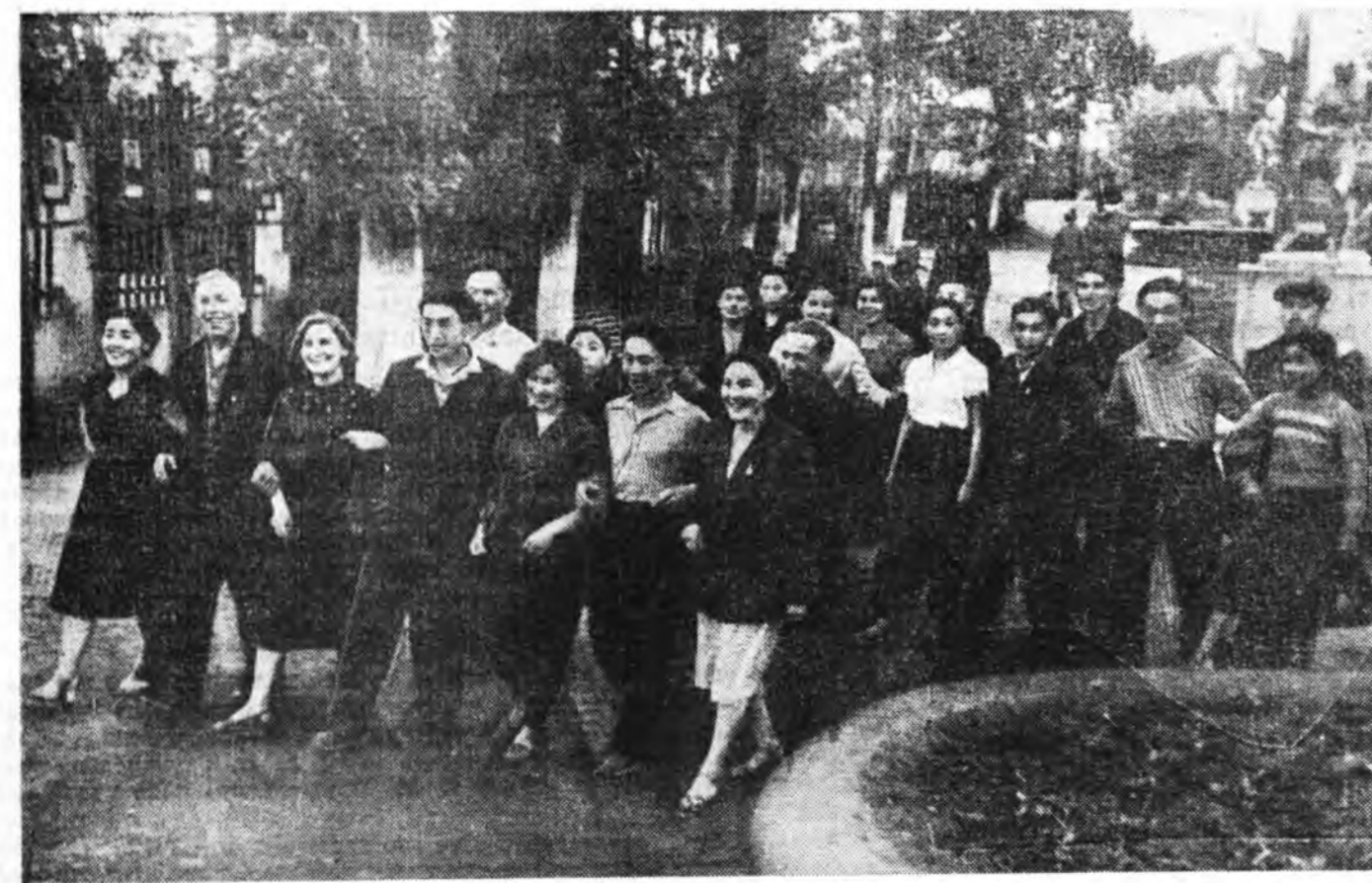
ЗУРАГ ДЭЭРЭ: Түнхэнэй аймагһаа фестивалда ерэнһэн бүлэг залуушуул сэнгэжэ ябана.