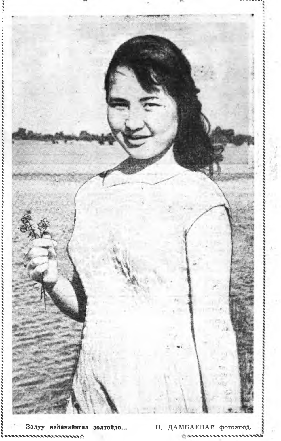
Залуу наһанайнгаа золтойдо...