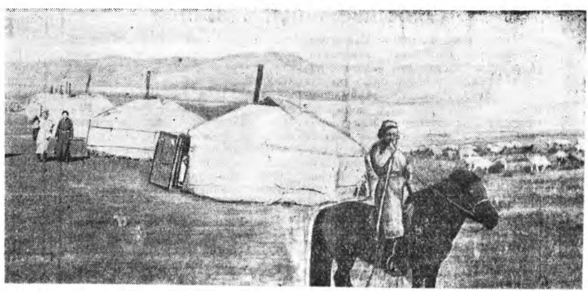
Түб аймагай «Партизан» нэгэдэлэй хониншодой нэгэ бригадала Жэл бүри хонин бүхэнһөө хурьга абажа түлжүүлдэг түрүү хониншон Тэнзээгийн Эрдэн хониндоо бэлшээрнэе гаргажа ябана.