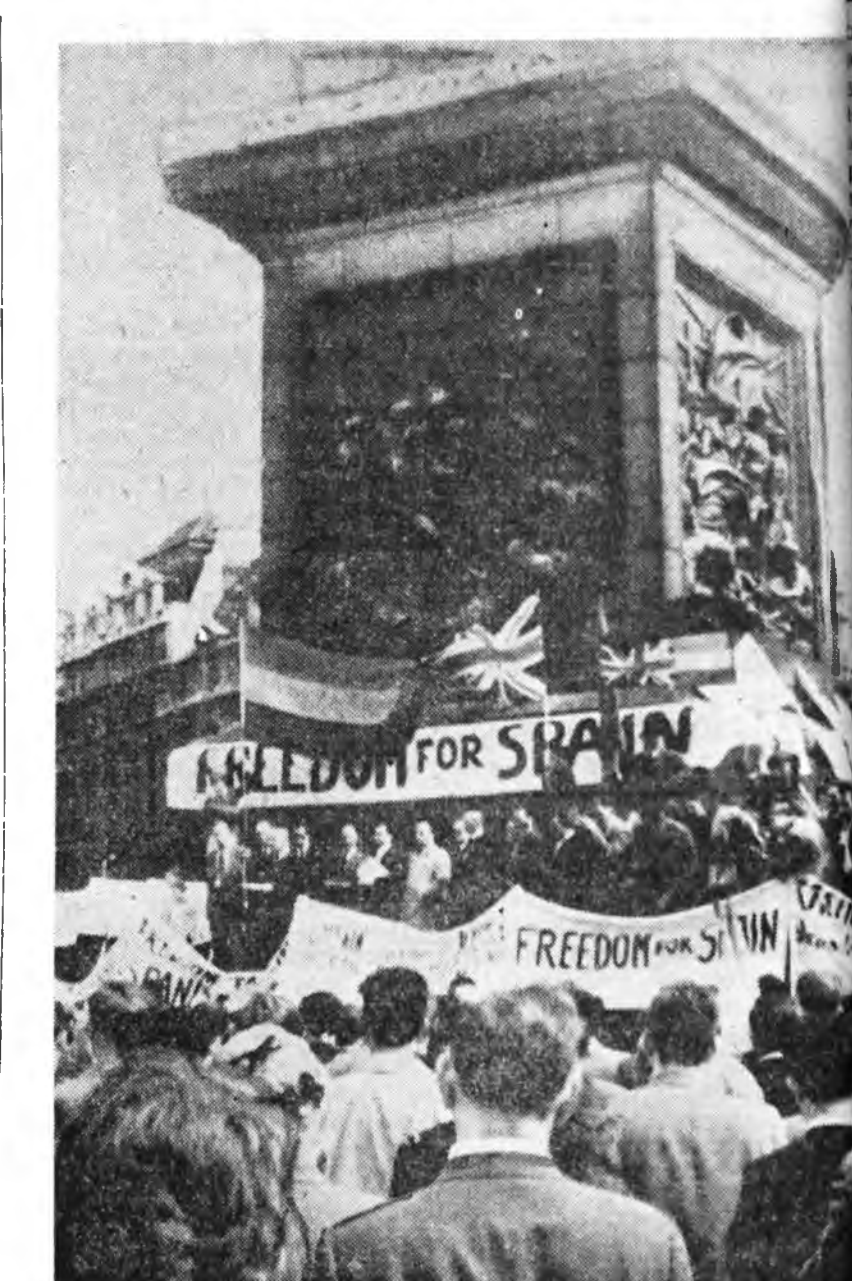
АНГЛИ. Франкогой Гадаадын хэрэгүүдэй министр Кастилья Лондон ерэндэ Англин олонинтэ ехээр дураа гутаһан Кастилья гэгшын Лондон ерэхэ үедэ Трафальгар гэжэ сээрлигтэ бурхын ехэ митинг боложо, тэрээндэ Лондоний олон мянган хүн зон, һаа гаража ерһэн эмигрантууд хабаадсалса. ЗУРАГ: митингын үе хабуулагдаһа.

Һанал нэгэдэлгын демонстраци тухай митингүүд Пуэрто-Рикодэ, Аргентиндэ, Уругвайд, Эквадорто болоһон байна. Венесуэлэй, Перуегэй журналистнууд, Бразилиин, Чилиин, мүн Латин Америкын бусадшы ороноудай политическэ, нинтын ажал-ябуулагдаш Кубын правительствода, арадта амаршалгануудыг эльгээхэ зуураа, «июлин