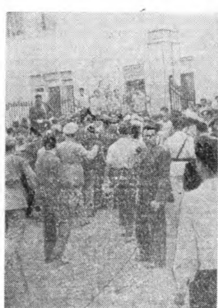
Арабуудай Нэгэдэмэл Республика. Дамьете городто хлонок ээрэдэг фабрика хаяхан баригдажа дүүрээ. Энэ предприятие Советскэ Союзай экономика, техникэсэ тулалмажаар баригдаа. Зураг дээрэ: фабрикын нэгдэхын урда тээхи үе харуулагдана.