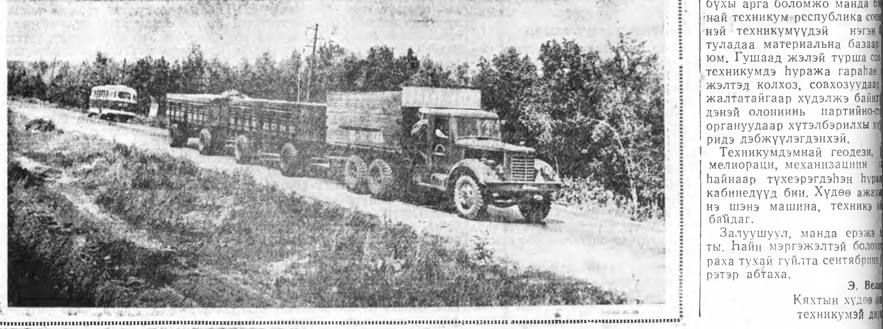
Кяхтын хүдөөн техникумэй дунда...