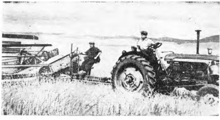
Энэ номериймай барлагдахаяа байхадань

Үргэн элдин таряалантай Анаагай совхоз байгша ондо аймагынгаа бусад ажыхнуудта орходоо хураггүй найн ургаса ургуулаа. Илангаяа 7-дохи фермэд ургуулагдана таряае харахада, томо томо колосуудаа ишэ тийшэнь гунхуулан миралзаад, урмтай даа. Эн-дэхид 370 гектарай га бүринөө 12—13 центнер хара таряа хуряахаар хараална.