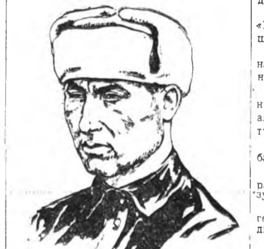
В. Жидяевый зураг.