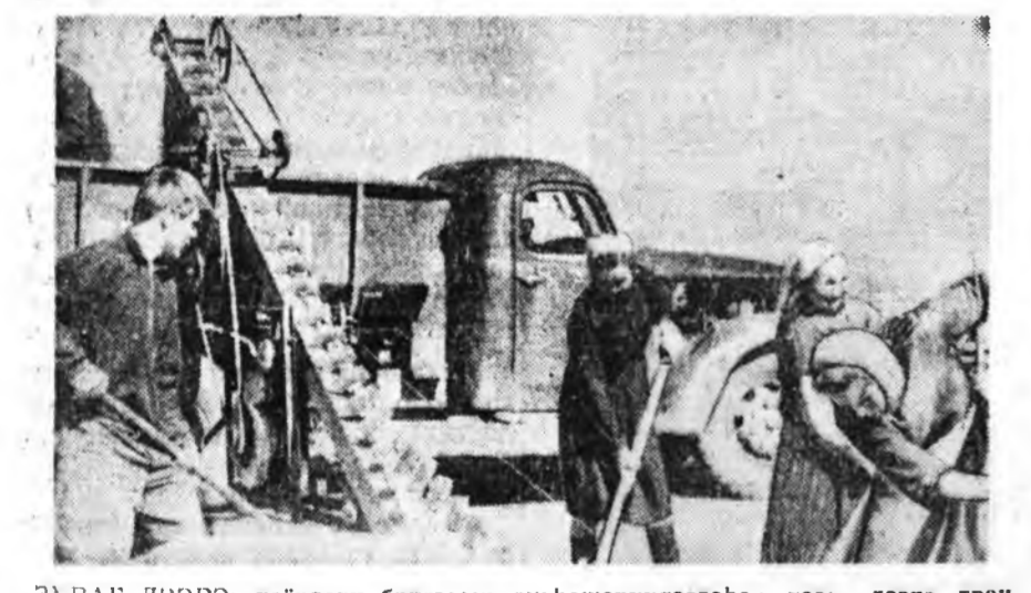
ЗУРАГ ДЭЭРЭ: хоёрдохи бригадын ошонжоруулагдана тоо дээрэ транспортёрроо тарла ашахань харуулагдана.