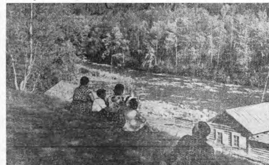
Хадын Гаарга горхойн эрьдэ...