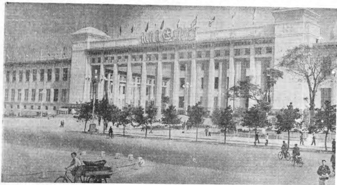
Хятадай Арадай Республикын нийслэл Пекин город, Тяньаньмынь талмай дээрхи Түүхын музейн байхан.