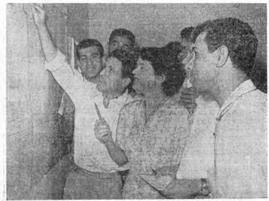
БАГДАД. Ирагай Республика Советскэ Союзһаа материална, техническэ туһаламжа абажа байдаг. СССР-эй дээдэ хургуулинуудта Ирагай студентүүд хурадаг. Ирагта элдэб промышленна предприятинуудыг болхохо проектнуудыг зохёолдог, тэдэниг барилгада Зураг дээрэ: Багдадта электростанци инженерүүдыг советскэ мэргэжэлтэд