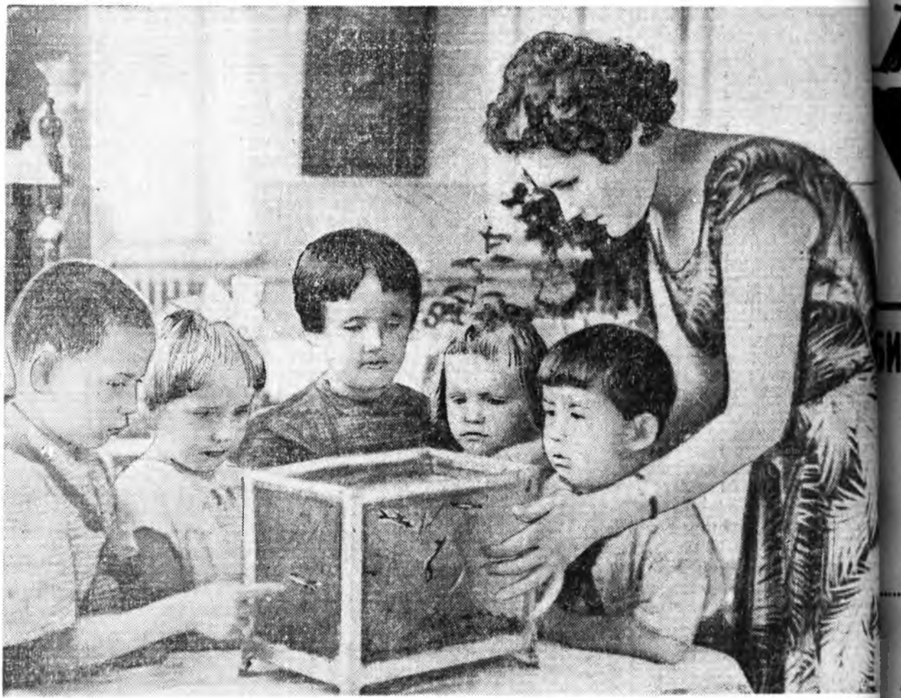
ПВЗ-гэй 16-дахи хүүгэдэй садта. Хүмүүжүүлэгшэ А. А. Лобова акварнум соо байһан заахан загараһан үхибүүдтэ харуулжа байна.

Гэбэшы королевскэ сэрэгүүд урдаһань шангаар довтолжо, үймөөшдэ Паксан тээшэ суварихынь баалханан байна. Ассошиэйтед Пресс агентствын Вьентьянай корреспондентын мэдэсэнэй ёһоор, Лаосой нислэлдэ бэхжүүлгын хүдэлмэри хэгдэнэ. Меконг мүнэнэй эрьбэе зүбушуулан миномедууд тодхолоо.