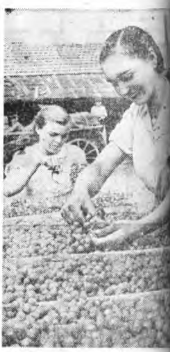
МОЛДАВСКА ССР. Странрайонной Мичуриннай парамэжэтэ зойхид жэл бүри үрэ жэмэстэ малуудай бани ургаса абана. Шын долоон хоногой туршда Москва, Ленинград хотодо 30 үрэ жэмэс эльгээбэ. Зураг дээрүүн гарһаа: колхозон гашуу тина Мадан үрэ жэмэсүүдыс жа байна.

Тингэбэшн Вашингтон өөрынгөө хараа болшыс, ядахын сагта Англи тушаа хараа бодоолоо шэнээр хаража үзэхэ баатый болоо ха. Америкын гүрэнэй томо томо ажал-ябуулагшадгай Англин гададын хэрэгүүдэй министр лорд Хьюмэй хөөрлөө хэлэнэй һүүлдэ Макмилланай Нью-Йорк ошохо болоһон тухай шиндхэбэри гараһанин анхал татана.