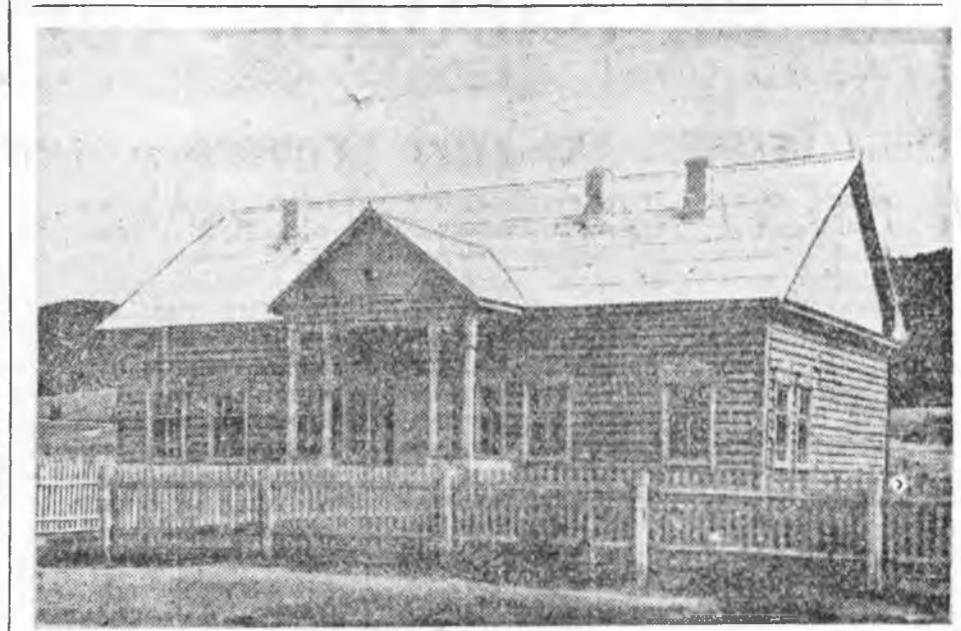
Түлэй жэлнүүдтэ республикын колхоз, совхозуудта олон клуб, культ-базанууд баригдана. Хаяхан Прибайкалин аймагай «Путь к коммунизму» колхоз Нестерове тосхондо шэнэ клуб барига дүүргэбэ. Эндэ 120 һууритай харалгын зал, библиотека, уншалгын зал, фойе бин. Зураг дээрэ: тус клуб.