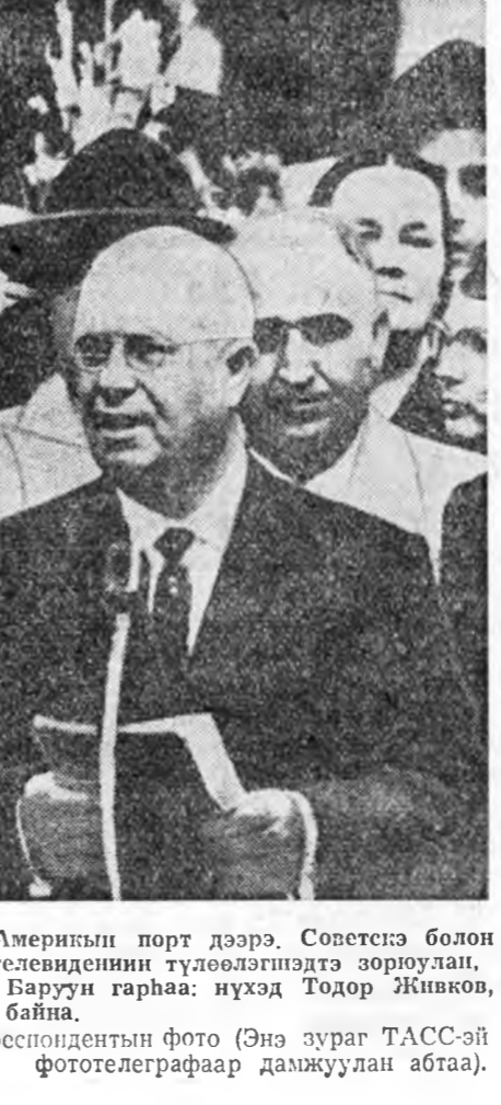
Нью-Йорк, сентябрьн 19. Америкын порт дээрэ, Советскэ болон гадаадын ороноудай хэблэлэй, радиогүй, телевидениин түлөөлөгшэдэ зориулаа. Баруун гарнаа: нүхэд Тодор Живков, Н. С. Хрущев, Г. Георгиу-Деж гэһэдэ байна.

Советскэ Союз бусал гүрэнүүдтэй хамта буу зэбсэг хуряаха асуудалаар 10 гүрэнэй комитэдэй хэлсэндэ эдэбхэнтэйгээр хабаадажа, буу зэбсэгүүдые бүгэдэһинтээрээ, бүрш хүсэдөөр хуряаха дотор бэлдэх гэжэ оролдон байна. Советскэ Союз өөргөөд хамгаалхын тулада, союзнууд ба ханнарайнага ээрхэг түрмүүдэй долбоолдо ороо хань—тэднэй үмэнэ уялгага дүүргэхин лэ тулада шухала болохо зэбсэгтэ хүсэтэй байна гэжэ Советскэ правительство, эб найрамдалта дуратай политиктаа сэхэ шууд баримталаа. ООИ-эй Генеральна Ассамблейн энэ сесси дээрэ хүндэтгэйгөөр мэдүүлнэ. Манай зэбсэгтэ хүсэн оидоо зорилгодо хэрэглэгдэхгүй байха, хэрбэ хэрэглэе наа—Совет гүрэнэй үг урхад, эб найрамдалта гадаадын политикын энэ үлдэнгэ зүрхшээ бичүү.