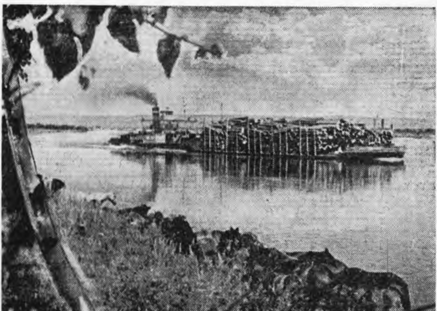
Барилгын модон арадай ажахьда...