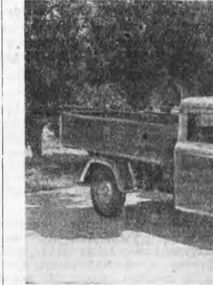
«КИМ-2» гэжэ ашаанай автомобиль бүтээгдэдэ, туршигдажа байна. Зурга ашаанай автомобиль.

ленностине шондохин һалбэхэ гэшэ арвай ажахыда угаа ехэ улашанартай. Шахтернуудай ула бурин бүтээсэ 83 процентээр дээшлэхэ, тоһо нүүрһөнэй өөрын үнэ 26 процентээр химдаха байна. Бүхы шахтанууд аштагтайгаар хүдэлдэг болохо.