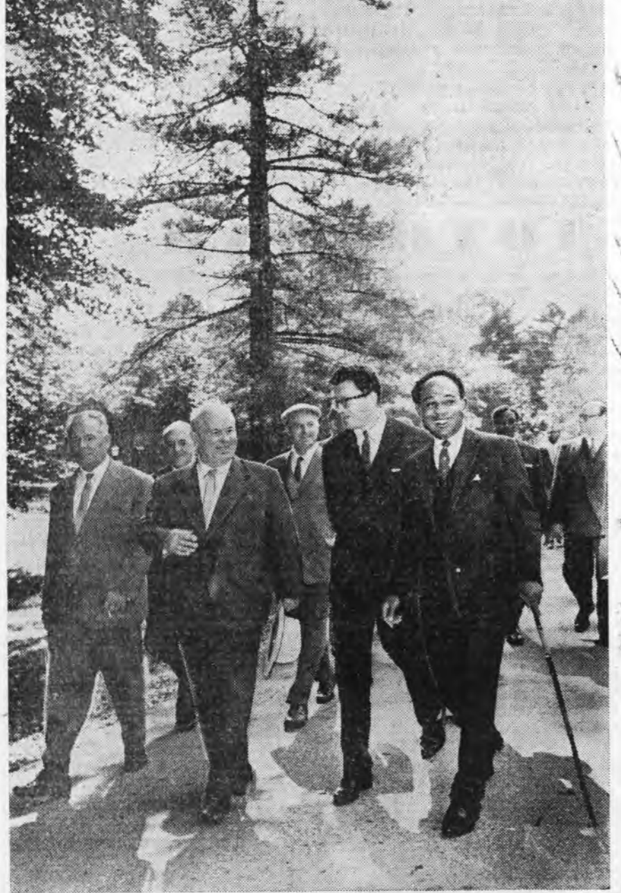
НЬЮ-ИОРК. СССР-эй Министруудэй Советэй Түрүүлэгшэ Н. С. Хрушев 2-то Нью-Йорк шадархи Гленковто Ганын Республикын президент К. Нкрума (берун гарһаа) сээрлэг соогур ажаба байна.

Алжирай Республикын саг зуурын правительствын Министруудэй Советэй түрүүлэгшэ Ферхат Аббас Пекинхэ «ТУ-104» самолёдоор октябрийн 6-да Москвада ерээ. СССР-эй Министруудэй Советэй Түрүүлэгшын Нэгэдлхи орлогшо А. Н. Косыгин, бусад тухай тухашалта хүнүүд, тэршэлэн СССР-тэ