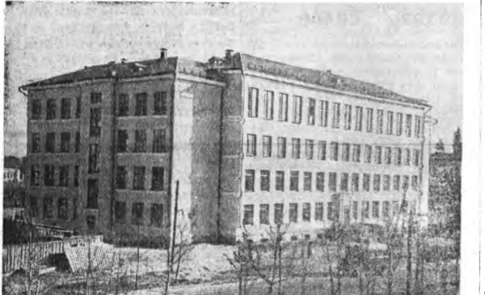
ЗУРАГ ДЭЭРЭ: багшанарай институтай шэнэ байһан.

Нургададай энэ үүсхэлые багшанарше, ВЛКСМ-эй райкомше хайшаагаад, түрэлхидэй, эмхи зургаануудай зүгһөө туһаламжа үзүүлхынь гуйһан байна. Түрэлхидэй комитет үхибүүдэйнгээ үүсхэл дэмжэлсэн, барилга дээрэ хэнэй хэзээ гаража ажаллаха график зохёоһон байна.