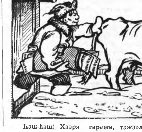
Баш-баш! Хээрэ гаржа, тэжээл бэдэрэ гэнэм...

дунда 4 час. Харгаһатада цыг 4-дэхи комплексно бри-фермэдэ ерэхэдэмнай, һу т-абадаг гэр руу хэдэн хаали-