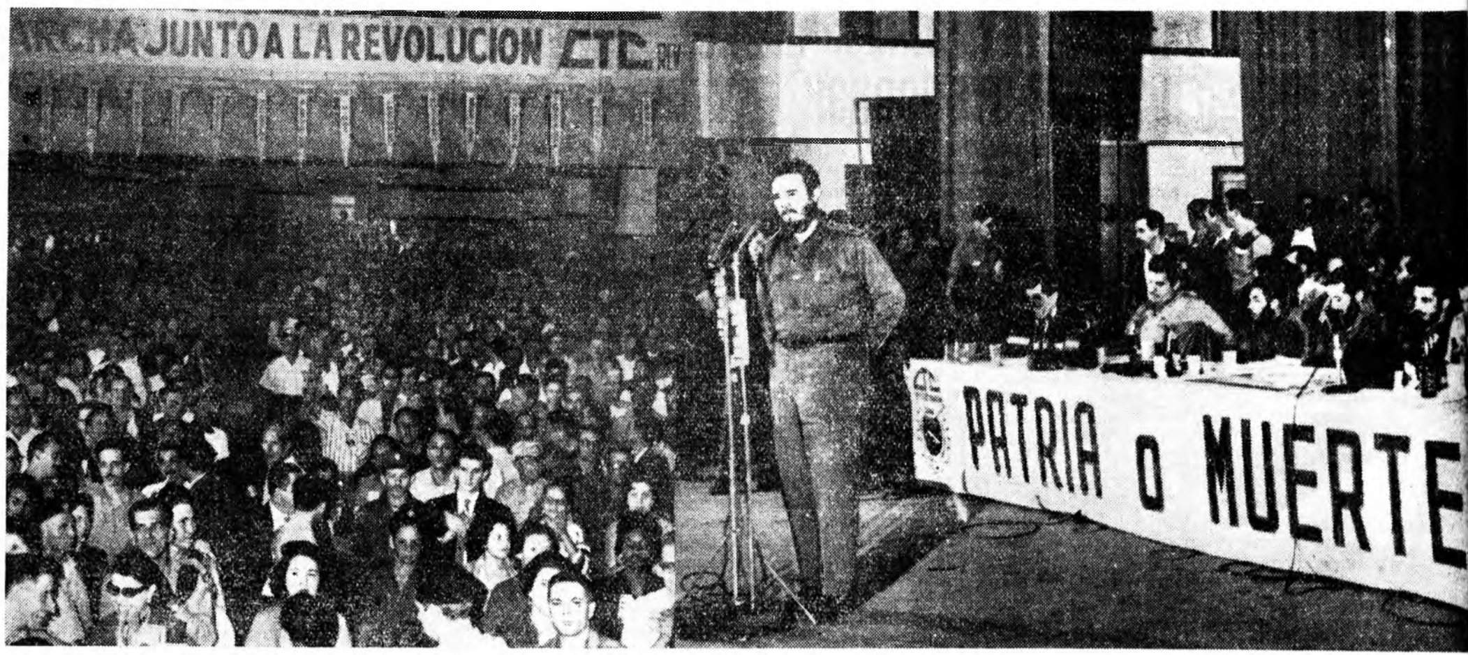
Кубын Республика. Нинтын организацинуудай түлөөлэгшэдэй зүблөөнэй Гаванада болоходо олон хүн хабаалаһан байна. Хүдэлмэрилэгшэдэй спортивна бүлгэмүүдые, хүүгэдэй эмхи зургаануудые байгуулаха тухай шийдхэбэри тэрэ зүблөөн дээрэ баталан абын Зураг дээрэ: премьер-министр доктор Фидель Кастро элидхэл хэжэ байна.

Дүрбэдэхи уулзалгын хүүлээр хүдөө ажахын хүдэлмэрилэгшэдэй профсоюзай 1-дэхи команда түрүү хуури эзэлһэн зандаа. Тэднэр 46 очкотой болонхой. 41 очко олоһон геологууд хоёрдох, 40 очкотой культурын хүдэлмэрилэгшэдэй команда гурбадахи хуурида ябана.