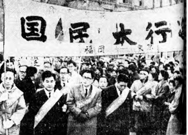
ЯПОН. Токно хүртээр, мянган километр аяншалда гараха хүнүүдые үдэхэнь тулада Кюсю арал дээрхи Омута городой мянга шаару хүн мингэн эхэ. Оройно бүхы хубууудһаа аяншалжа, Токно орохо хүнүүд тэндэ уулаха байна. Тэдэнэр үгтэй ядуу байдалда, худэлмэригүйдэлдэ эсэргүүсэн, хамтаараа тэмсэл хэхэ байна.

Январь нарада Англи гурин үбшүнөө 1.453 хүн үбшэ. Энээн тухай Англин зарим хамгаалын министрэн мэдээсэ. Газар доро байдаг 10 мян бункер ФРГ-дэ баригдан байна. Агаарай довтолгоо хамгаалахэ сипиальна постууд тэдэ бункернуудта байха мэдээсэ.