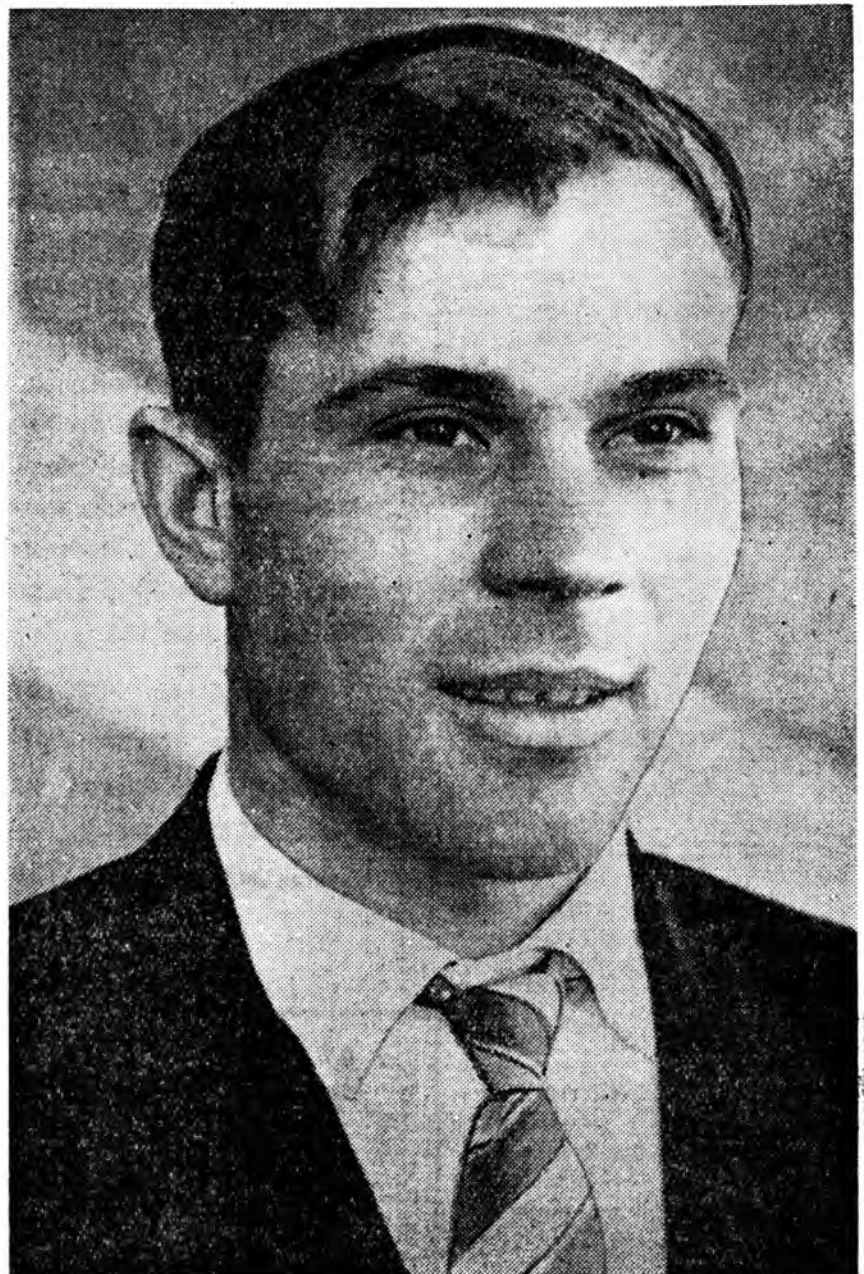
Нүхэр Корсуковой хүтэлбэрилдэг бригада Баргажанай леспротомхой «Лебяжий» гэжэ участога ажалладаг юм. Тус бригадынхид абанан уялгала дүүргэжэ, коммунистическэ ажал...