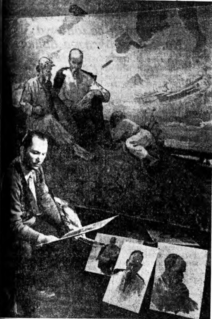
УКРАИНЫН ССР. Украинин агуухэ пост Тарас Григорьевич Шевченкона наһа бараһаар зуун жэлэй ой марта гүйшээ. Агуухэ дуушда зорюулагдан шэзэ зохиолдуудыг шуудангай тулада Украинин олон зурашад, скульпторнууд үүсэ хүдэлжэ байһаа. Арадай позды драксаалыс ёһолоһа уеда Киевтэ нээгдэжэ выставкэ дээрэ эдэ зурагууд табигһаа юм.