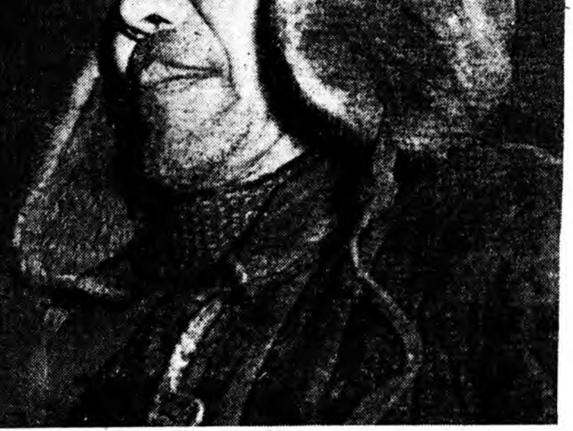
Эрхим хонишон Дондок Ринчинович Дугаровые Хорин аймагай Анагай совхоздо үбээн, залуугай мэдэхэ байха. Ажаша үбгээжөөл нёдондо жэлдэ хонин бүрһөө 3 килограмм 400 грамм нооһо хайшалха үялгатай аад, 4400 граммда хүргөө хэн.

Ажархай унгуур гурьдөө худалдажа, нэгдэхэи элбгээхэ, хэблэхэи элбгээхэ, хэблэхэи элбгээхэ, хэблэхэи элбгээхэ.