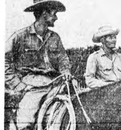
КУБЫН РЕСПУБЛИКА. Мансанилһооо холо баша фермын тарлашад-малшад.

ВНР-эй правительствын түрүүлгшэ Патрис Лумумбын хамтаар эльгээгээ.