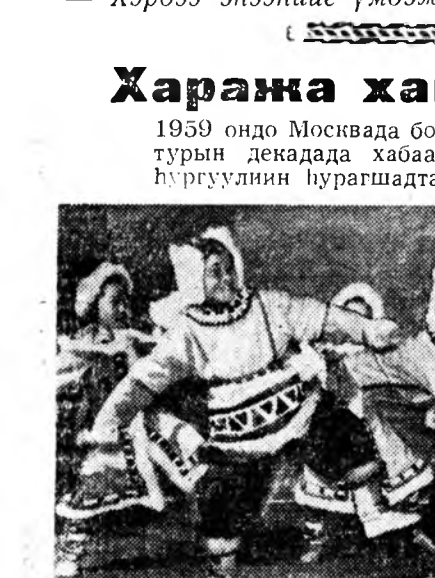
Зураг дээрэ: эвенк арадай «Баабайн хүбүү» гэжэ хатар.

1959 ондо Москвада болон бурдад искусство, литературын декадада хабаадаһан Улан-удын бурят интерна-т хургуулиин хурагшадта зорюулагдаба.