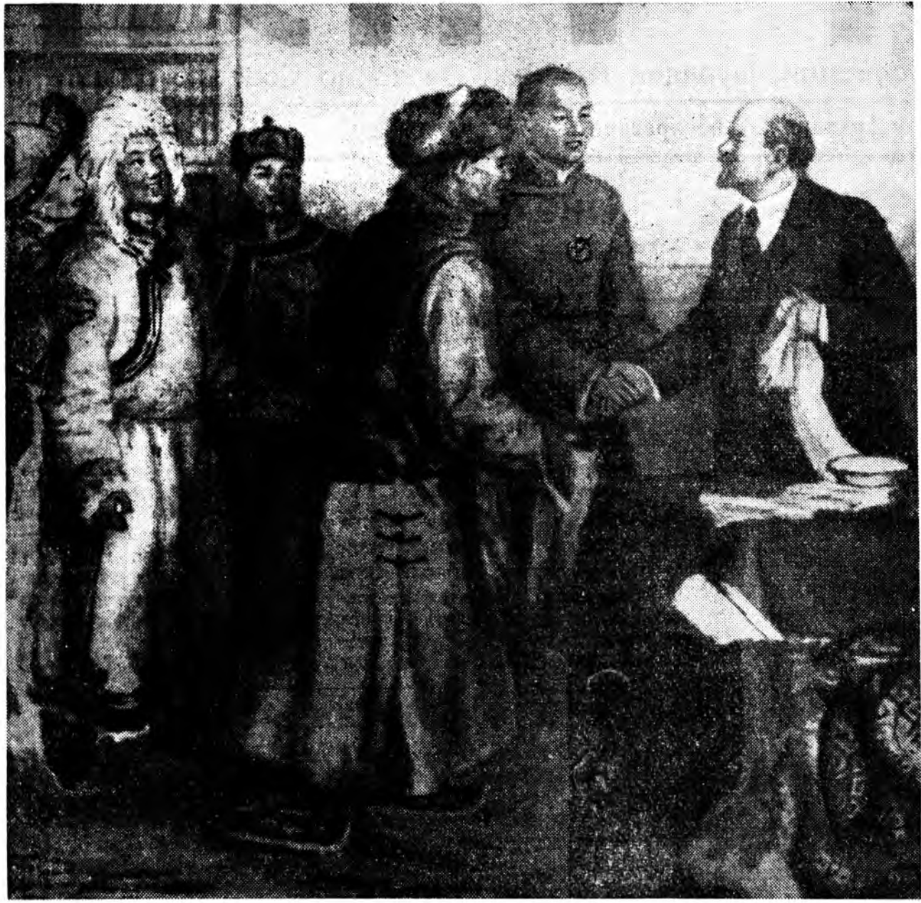
«1921 ондо Монголой түдөөлөгшөд В. И. Ленинэй уулзажа байна».