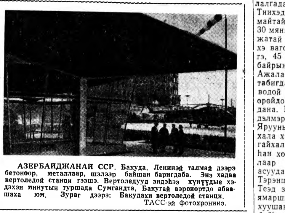
АЗЕРБАЙДЖАНАЙ ССР. Бакуда, Лениней талмай дээрэ бетоноор, металлээр, шэлээр байһан барилдаба.

Гэхтэй хамта, республикнай олонхи аймагуудта элдэ түхээрлэгнүүд хангалтагүйгөөр ашталгана.