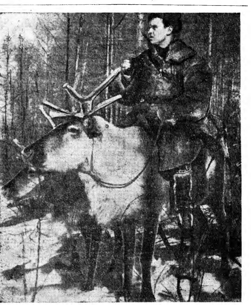
ТАЙГА СОО... В. Шитиковэй фотоэюд.