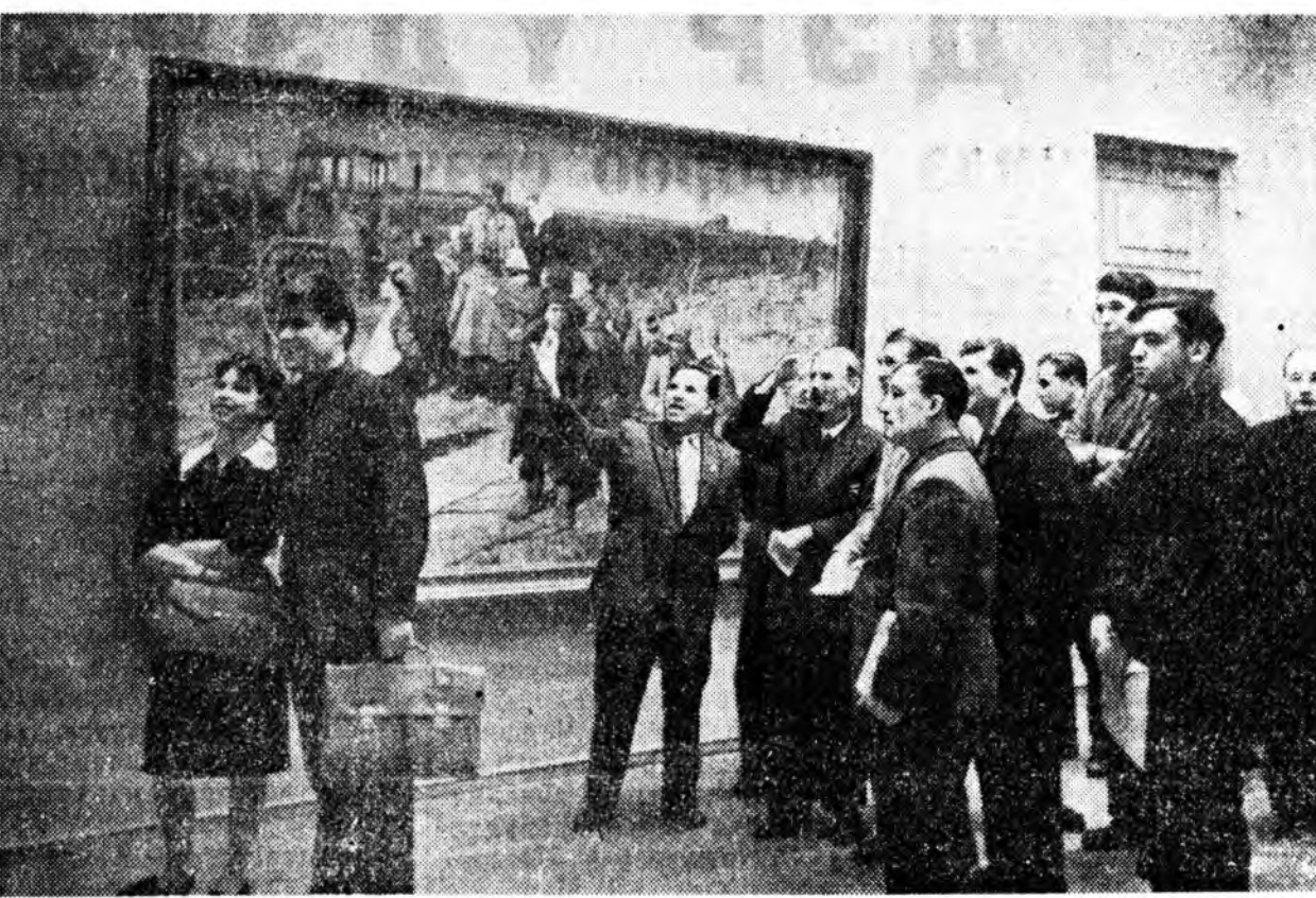
МОСКВА. 1961 ондо ленинскэ даһан зурагуудай выставкэ дэ нэгдээ. Зураг дээрэ: хүн зон шан олгохын тулада зууршалг СССР-эй Уран һайханай академидэ выставкые хаража байна. ТАСС-эй фотохроноко.

Малша бурят, таряаша ород — булта Манай үеын баатарнууд гэшэ. Дабшаха бүримнай дардам болодог, Амжаха бүримнай аажам болодог Аладейнай харгы сэхэ байна, Америкые хүсэхамнай ана мана. Хорин хоёрдугаар, Хорин хоёрдугаар, Коммунизм байгуулагшадай хуралдаан! Эдэ үгнүүдхэ зүрхэнүүд долоно, Энхэ байлгэй энжэ болоно... Жаргал золот жорхой харгыгаар, Жаран хүлэгэй долгин шадалаар Жэгтэй нонин телевизорей ноцад, Жороо табин, Бурятдам гүйдэг! Улаан Удын оройе данзэлхэн Урга үндэр багана дэрлэн, Уран зурагаа ажал дээрэ бөлдөг, Ууган Байгалаар дүүрээсэ дэлгэ! Үлээрэнэдли шүүһэн улаан Үүрэй туяан, Солбоной туяан Гуурһан дээрэм голди гүйлгэнэ. Саарһан дээрэм сараа зүйлгэнэ... Миндаһан дээрэнэ магнитофоноор Манай дуунууд мүнхөөр эдэлдэг, Маяковскийн бүшмэг хоолойгоор Маяк-гал бадаруулан эдэлдэг! Уридаһан урда ама барһан, Барилдаһан баруун захараһан, Мүрһөөнэй мүн шаһар шудалһан, Хани барисаһанай халууе хамталһан Олон яһатан — ажалай баатаршуул, Онһо дүршэлтэн, оюун мэргашүүд, Таанарай илалта магтан дууладаг Талаантай шүлэгүүд мянгаар манда! Хорин хоёрдугаар, Хорин хоёрдугаар, Коммунизм байгуулагшадай хуралдаан! Хуралдаан зүрхэнүүд долоно, Эльгэ зүрхэмни бахархан долоно... Нигжэ Эдэ шүлэгүүд болборсо.