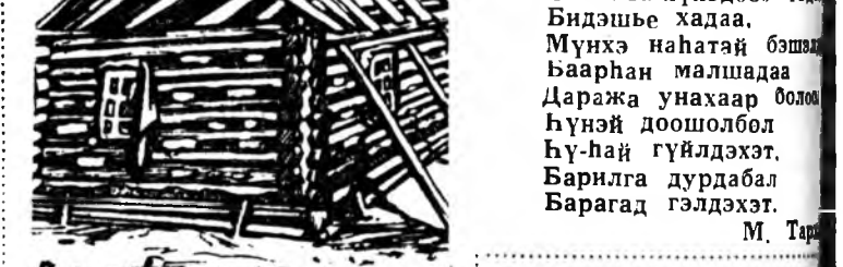
«Саг-сагтаа, Сахила-хүүдөө» гэдэ Бидэшые хада. Мүнхэ наһатай бэшэ бааран малшадда Даража унахаар боломо гүнай доошолбол гү-най гүйдэхэт. Барилга дурдабал Баргад гэдэхэт. М. Тар