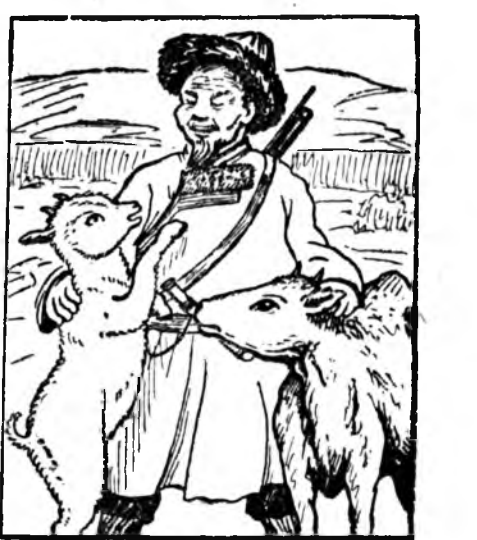
Ц. Гармаевай зурагууд.

Ганса нэгээрэ Гаржа эхилбэ. Буруу зорбон Булай шангаар. Бүдүүн гэшээр Бүрхирөөд абаба. Эшгэн тэхэ Эшхэрэн хагад, Бахардуу шангаар Бабанаад орхибо. Бүхы шононууд Бурил айшоод, Мэдээ алдан, Мэгдэн, гүйдэн, Үрдилдэн гараад, Үгы болошобо. Хаанинь хүүлдэнь Хашхаран, бархиран, Шэлээ таталдаад, Шэрэһээ хаялад, Нюдөө аняад, Шүдөө зуугаад, Газашаа гүйжэ Гаржа арилба. Ханинар хоюулаа Ханатараа хүхижэ, Эльгээ эгшээртэй Энээлдэжэ салаба. Амгалан тэниглэн Амаржа унтаад, Хагданда үглөөгүүр Бэлшэжэ ябатарнь Хаанашые ойрошог Буу гэнтэ наяршаба! Хоёр ханинар Гайхан зогсобо, Холуур дүтүүр Шэртэн хараба. Набтархан боролжын Наада тээхэнэ Ябаган ангуушан Ябажа ябаба... Хуугаад орхибо, Толгойгоо дээшэн Үргэн татаад, Хадхуу шэрүүнээр Хараашалаад абаба. Абажа абаһан Арһаа зорбон Нэжэрээд, нэжэрээд Нэгсэрээд абаба. Жэгтэйхэн юмэ Харанан шононууд Жэхылдэн айшоод, Шугшылдан хууба. — Хэд, юуд гэшэбта? Хэлэжэ хайрлыт. Хайшаа ошоотнайб, Хаана хүрэхэнайб? — гэд, Айшанхай хаанинь Аргадаһан шэнгээр Аргаахан асууба. Бугжагар сулахан Буруун бухманай Хажууһаан нүхэрөө Халдаад дооноуур, Хашамал хоолойгоор Хаанда харюусаба: — Аса туруутай Амитадай ахалагша Гүзээ ехэтэй, Гүндүү зоригтой, Алаг бээтэй, Арсалан түрэлтэй, Барас хүсэтэй, Баатар гэшэб! Үбэл болоходо Үмдөөд абаха, Даарабал хэдэрхэ Даха оёхоо Арһа суглуулжа, Агнажа ябаһан Ангуушан гэшэб! * Түгэсхэл, Эхининь мартын 18-най номерто.