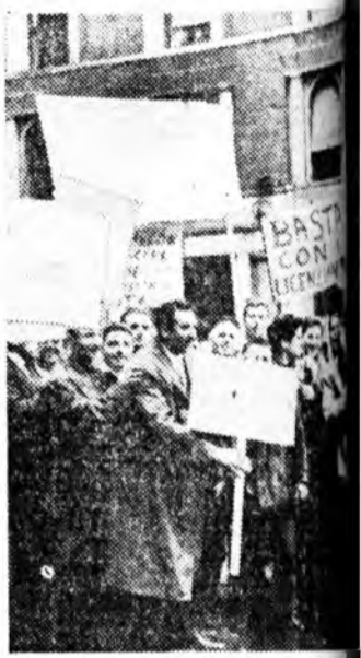
Итали. Миланай таксия догшод өөһэднгоо дүрбэн дэй ажалһаа гаргагдаһыг шаан, салин хүлээсэ дэлхэйн түлөө һалхан забастахидхээ. Зураг дээрэ забастахабаадагшад демонстрацияда лагдана.

ЖЕНЕВА, мартын 23. (ТАСС). Ядерна зэбсэг туршалгыг хорихо тухай асуудал зүбшэн хэлсэжэ байһан гурбан гүрэнэй зүблөөнэй ээлжээтэ заседани мүнөөдэр эндэ болоо.