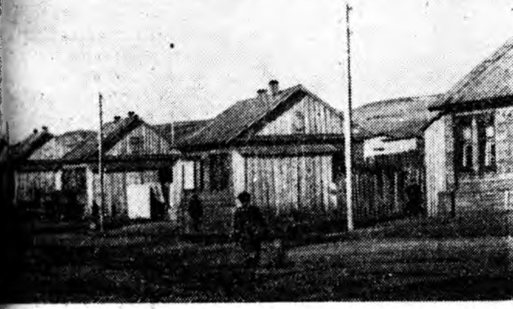
Х ОЁР тээхээ мульбөөр хүрээлэгдэн...