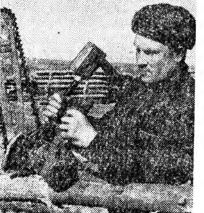
ришэдэй «манай түрүү жоолошон»...