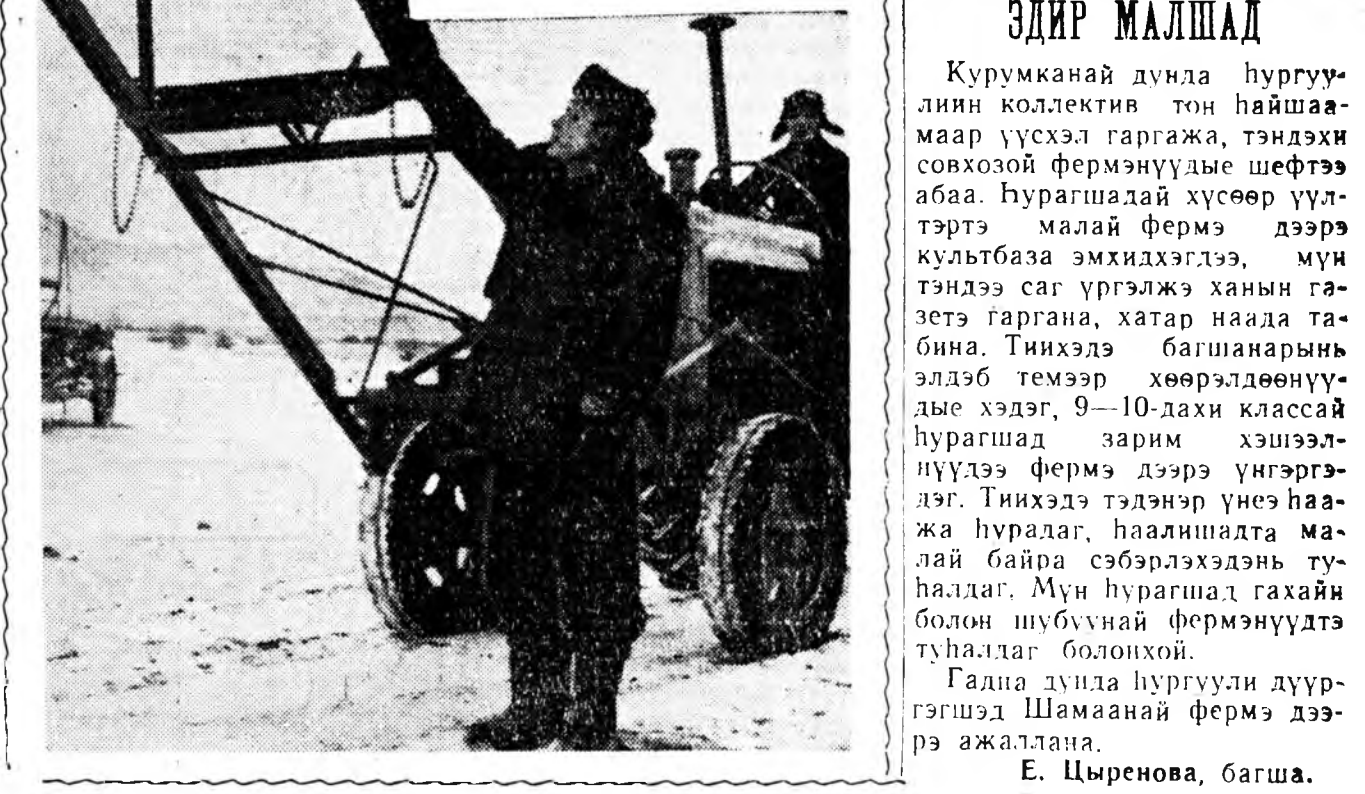
Галданов наг шэбхэ ашаалах түхээрлэг өөрөө зохиожо, мастерской соогоо бүтээгэд, тэрэнээ кукурузадагда үгэхэ, аялхтар ехэ туһа хүргөө. Мүнөө тэрэнэй маягаар тус совхоздо үшөө 6 тинмэ түхээрлэг хэдгэ юм.

Кударын совхозой механизатор Намсарай Доржиевич Галданов наг шэбхэ ашаалах түхээрлэг өөрөө зохиожо, мастерской соогоо бүтээгэд, тэрэнээ кукурузадагда үгэхэ, аялхтар ехэ туһа хүргөө. Мүнөө тэрэнэй маягаар тус совхоздо үшөө 6 тинмэ түхээрлэг хэдгэ юм.