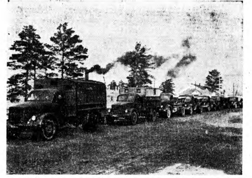
Үнгэргэжэ воскреснэд Анаагай совхозой 1-дэхи фермын кукурузын поли дээрэ 328 тонно шэбхэ гаргагдаа. Энэ эндэ сэмбын фабрикын 50 хүдэлмэришэд хабалалсаа. Зураг дээрэ: тус фабрикаһаа шэбхэ зөөлгэдэ гараха машинануудай колонно харуу-лагдана.

Мүнөө Анаагай совхозой нэгэдэхин фермые шефтээ абажа, эндэ 500 гектар тал-май дээрэ кукуруза тари-жа, ургуулагдаһан туһалха гэжэ шийдэбэди. Мартын 26-да 10 автомашина, 50