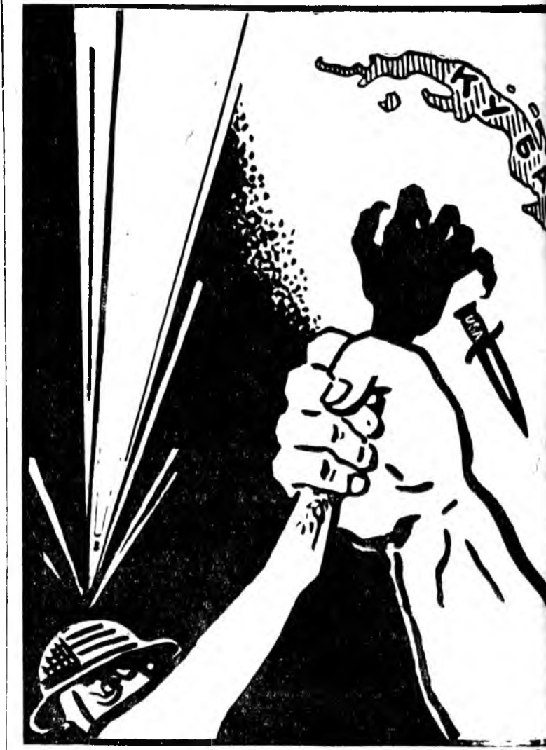
«Булшан, хатуу гартнай Булдал худэржэн, зангидаг лэ!» Ингэжэ талархан юрөөнэл, Энэ юртэмсын арад зон. Ч.Ц. Санжиевай үгэ, Н. Головановай зураг.

бэшы, энэ мэдээсэлэй, дамжуулагдаһанай нүүлээр тус радиостанцине правительствын сэрэгүүд эзлһэн байна. Тингэжэ Парижаа абтаһан мэдээсэлүүд, правительствын захиралтанууд дамжуулагдажа эхилээ. Үймөө үүсхэн генералнууды дэмжһэн европеец яһанай хүн зон үймөө үүсхэгшэды толгойлогшонорой городой гол талмайда ерхынь хүлэжэ ялаад, Алжиртахи Францин правительствын генерална делегатай байра тээшэ ошоһон байна. Эндэ эмих гуриггүй байдал тохөөлдөнхой байгаа. Эндэхэ үймөө үүсхэгшэдэй гол хүсэн болохо парашютистнуудэй нэгдэлхи дивизион солдалууды тэһэн ашаанай машинанууд гэдэртэ сухарижа байба. Байһан соо документнууд галлагдажа байгаа. Хаанаһаашьеб бунгай хүрэхэ абян соностоо. Шаль, Салан, Зеллер, Жуо гэшвэд хүнин хоёрдохы хахалта нэгэ машинада һүчгаад, Алжир городһоо уршаа гаража ошоо гэжэ тухайлагдана. Шаль гэшвэ нэгэ офицерээр дамжуулан Париж рув бээр эльгээгээ, эзмээ амасахар бэлэн байнаб гэжэ тэрэ бэшгэ соонь мэдүүлгэһэн гэдэ Алжирһаа абтаһан мэдээсэлүүдһээ элирээ.