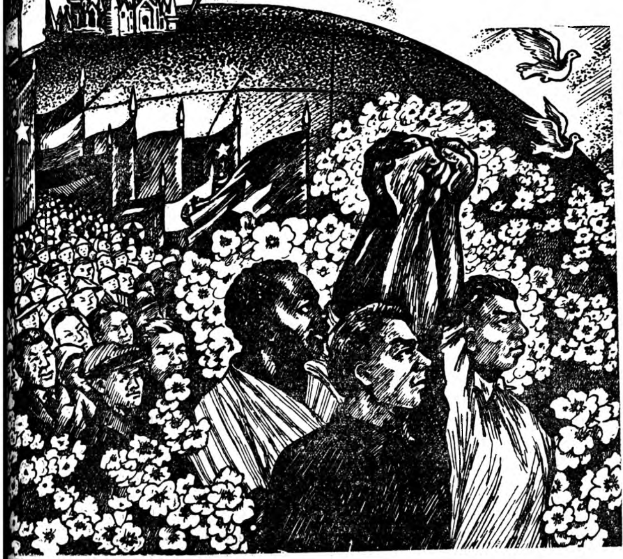
Ц. ГАРМАЕВАЙ зураг.