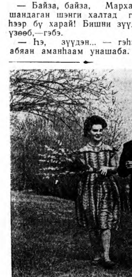
Хабарай сар... Хоюулаа үлээд ябахадатойгоёл гэжээл даа... Л. ХАЙДУРОВАЙ фототээд.

— Байза, байза, Мархай, шандаган шэнги халтад гэ- һээр бү харай! Бишин зүүдэ үзөөб, — гэбэ. — Нэ, зүүдэн... — гэнэн абаян аманһаан унашаба.