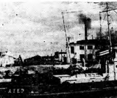
Уласхоорондын найн-гурбан хоногоор урид дэртэ ажалай бэлэг бол-ахилээ. Улан замшад гол Мөөрөөша, Харлан, Па-мүрүнүүдээр ашаа шэрэ-жэ эхилбэ. Ашаа шэрэл-жэ нёдондо жэлэйхиһээ түрүүшын замда «Юрий Смирнов», «Мир», «Кон-стантин Заслонов», «Фаватер», «Сергей Топенин» гэхэ мэтэ теплохалууд гараба.

Улан замшад найн-дэрэй үедэ арадай ажа-хан шэрээ ялга абажа, хо-лын харгы замда яаба.