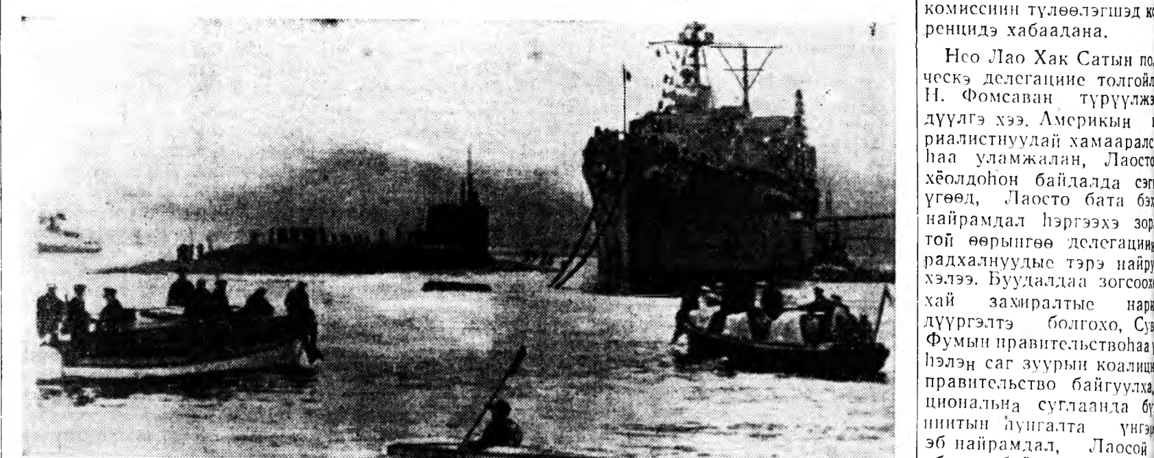
Шотландийн Холи-Лох гэжэ атомна онгосо мартын 8-да тамаран сэглэгдэнхэй. Англин арадай дура уһан доогуур ябадаг онгосонуудыс сонуудай түрүүшынхын болоно. ЗУРАГ ДЭЭРЭ: Англин далайн ябадаг онгосые «хамгаалан хаража» байна.

Республикын урда, түбэй районнуудта 2—4 миллиметр, Ула голлой зьедэ—6—9, Няхтын Хамнигадай нотагта—15, Орлмгто—18, Түнхэнэй Мондо нотагта 33 миллиметр хүртээр шиг нойтон ороһон байна. Үнгэрһэн үе соо дунда зэргээр газарай хурьһэн доошоо 10 сантиметртэ 5—8 градус, Петрозавловкада —10, Л. Гончарова, агрометеоролог.