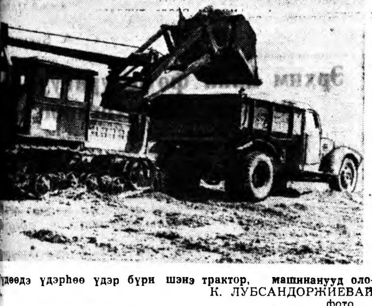
Худөө үдэрһөө үдэр бүрн шэнэ трактор, машинанууд оло-

Колхоз, совхозуудай трактор болон худөө ажахын бусад машинануудай заһабарилгы эмхидхэхэ, машинно-тракторна паркнудай ямар асаргагдажа байхынь шалгаха, хэрэгтэй сагтань тубаламжа хүргэхэ зорилготой. Мүн мэдэлдэ байдаг нэ-