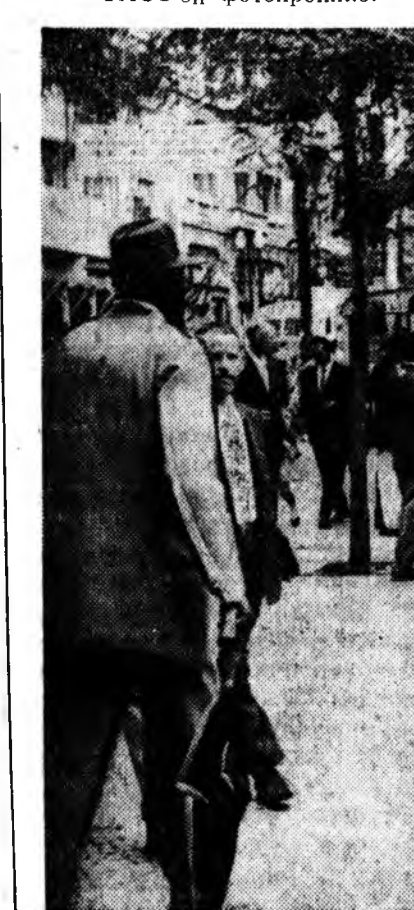
БРАЗИЛИ. Сан-Паулу. Хүдэлмэригүүшүүл ажалда абадаг газарта суглараад байна.