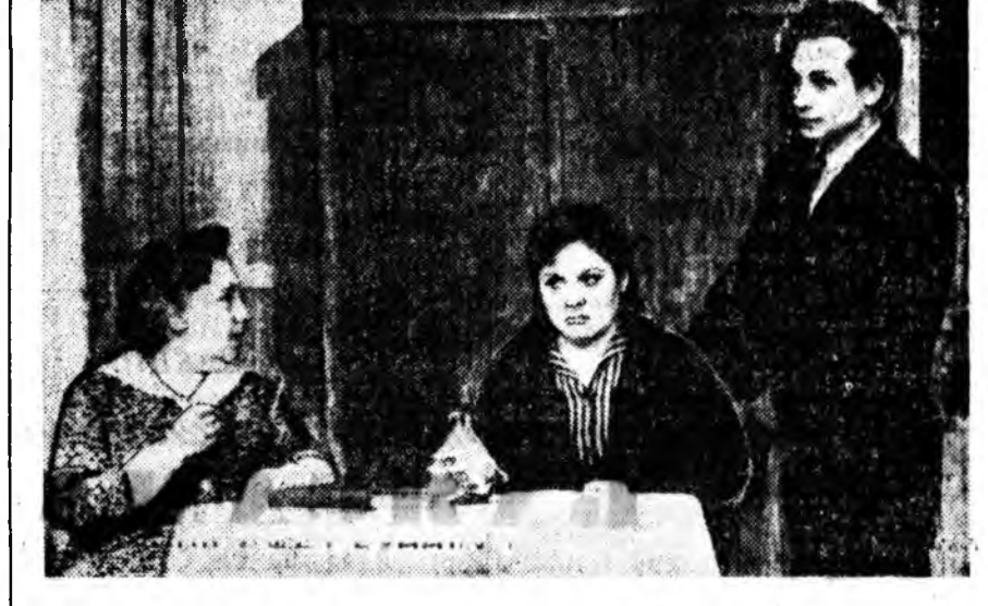
Гүрэнэй ород драмын театрын коллектив А. Успенскийн «Девушка с веселыми глазами» гэнэн жүжэе ажаллагдаа харуулма эхилэхэй. Зураг дээрэ: жүжгийн нэгэ үйлэ харуулагдана.