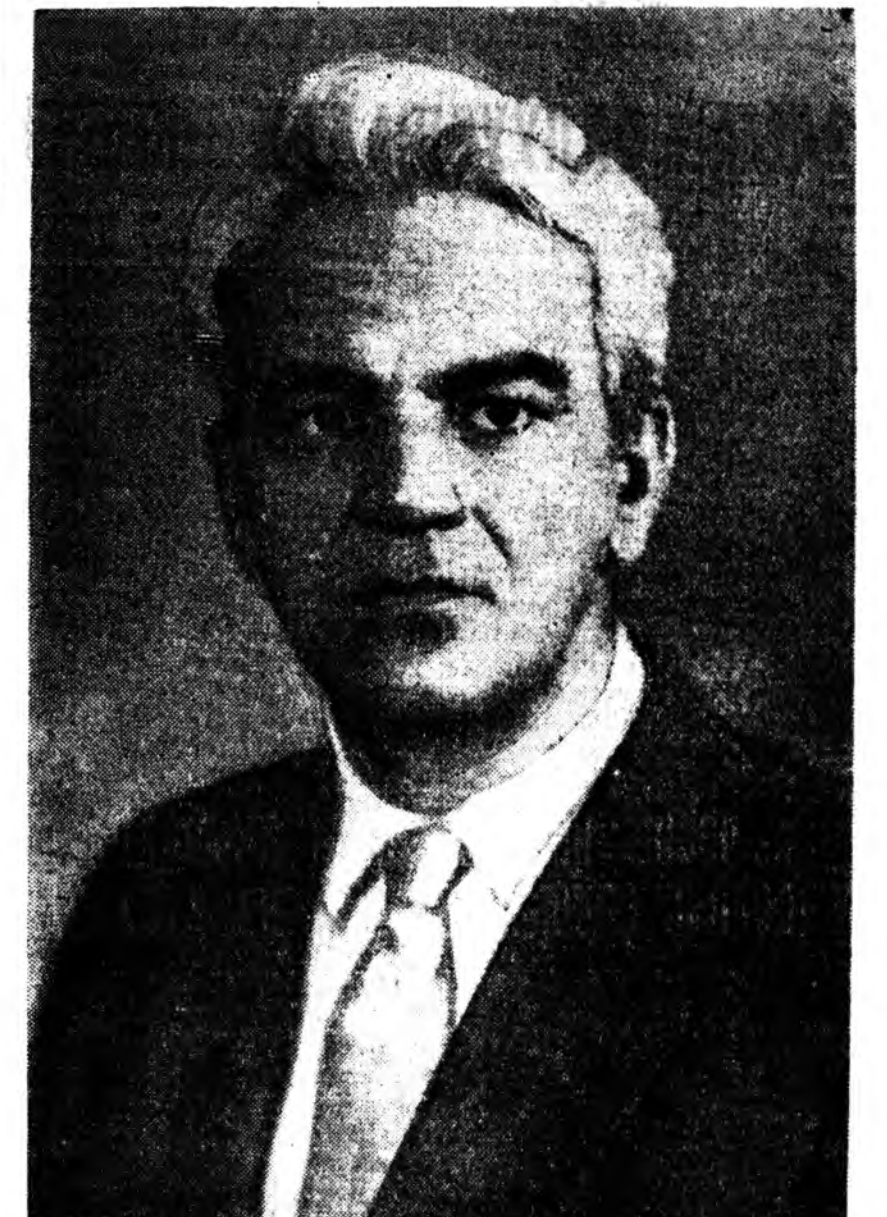
1961 оной майн 19-дэ акаде-минийн шийтэм сүлжээгээр СССР-эй наукануудай академинийн президентээр һунгагданан академик М. В. Келдыш 1911 оной февралын 10-да түрөөн юм. Москвагай түр-ной университетдэ дээдэ эрдэнэ абаһан байна. 1931 ондо тус уни-верситетдэй физико-математиче-ска факультет дүүргэбэ. 1949 ондо КПСС-эй гашүүн болонхой.

Манай үс сагай науца тон орёо бэрхэ асуудалнууды шэнжэ-лэн тодорхойлохо научно-шэнжэл-хы эхэ хургуулинууды М. В. Келдыш бин болгоо. Тийгээд ажал хүдэлмэриин хуульчартай ябуулан юм. Ашаг эхэтэйгээр хүдэлдэг, үргэн дэлсөөтэй, бэлн-тэй эрдэмтэ байһынь тэрэнэй науца шэнжэлэгшүүд тарилга-да. Мүн тэрэнэй шайбарай, хү-тэлбэрилдэг шэнжэлхы коллектив-тэрэнэй хэһэн хүдэлмэри туһа эхэ удхалтанартай байгаа. Ингээд гидродинамика, аэродинамикин асуудалнуудтаар хэһэн шинжэлэг-шүүдынь түнээгэй удхараа, тоо болонгын тон нарин баримтану-даараа онсо шалгардаг.