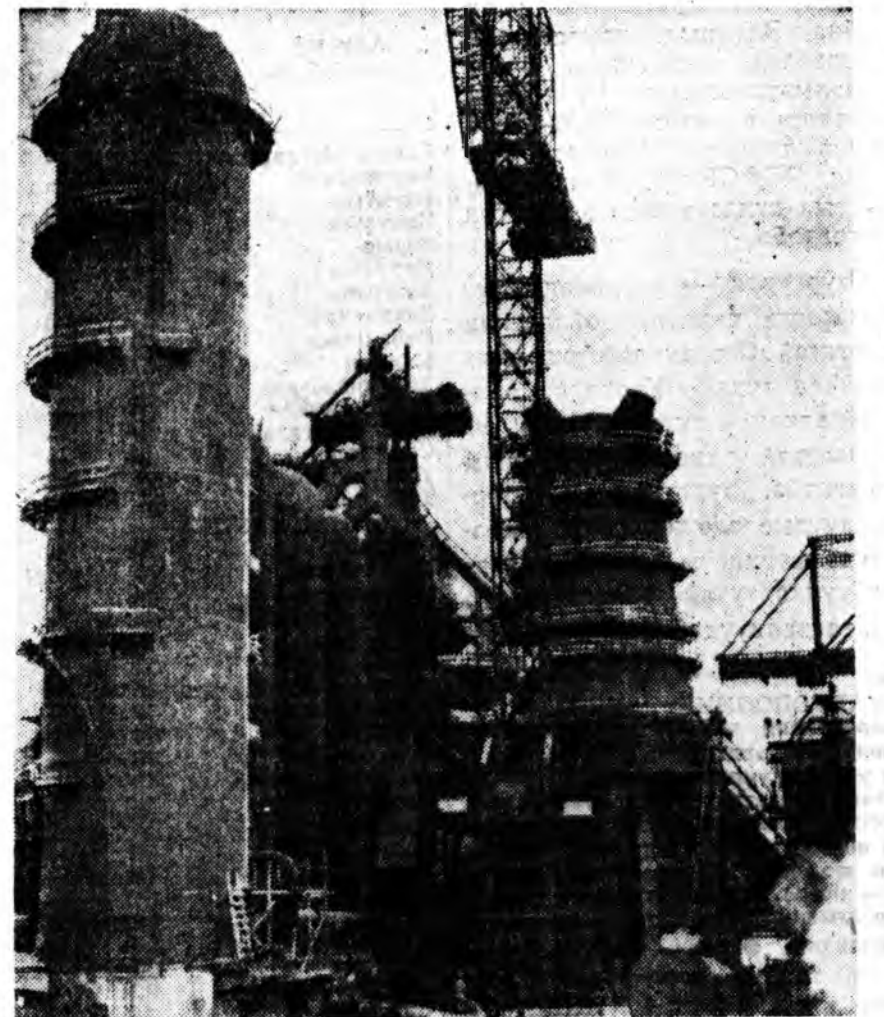
Дайнай урда жэлүүдтэ баригданан Новотульская металлургическа завод шиндхэн завагдажа, үрхэдхэгжэ байна. Долоон жэлэй туршда энэ завод оройной мшэй эгээ эхэ предпритинуудай үзэг болохо. ЗУРАГ ДЭЭРЭ; баригдажа байһан домна.

Абалан уялгаа амжалтайгаар дүүргэжэ байһан энэ заводойхид Заптрайн аймагай Хүндэлэлэй самбарта бэшгэдэбэ.