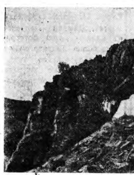
ЗУРАГ ДЭЭРЭ: Алханын «Үүдэн сүмэ» гэжэ нэрэтай хабагай шулуун.

Алханын зүүн ташаланда «Юһэн хооботой аршаан» гэжэ нэрэтай хүүюр гол урдадаг. Энэгээр элдэй гэсын үбшэ аргалдаг гэжэ мухар һүзэгтэн дуулаад, нишэ ерэжэ, хүүүү-