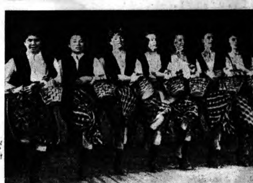
Закаменай Культурн байсангай хатаршад «Ур эжмэс суглаула» гэж хатар гүйсэдхэж байна.