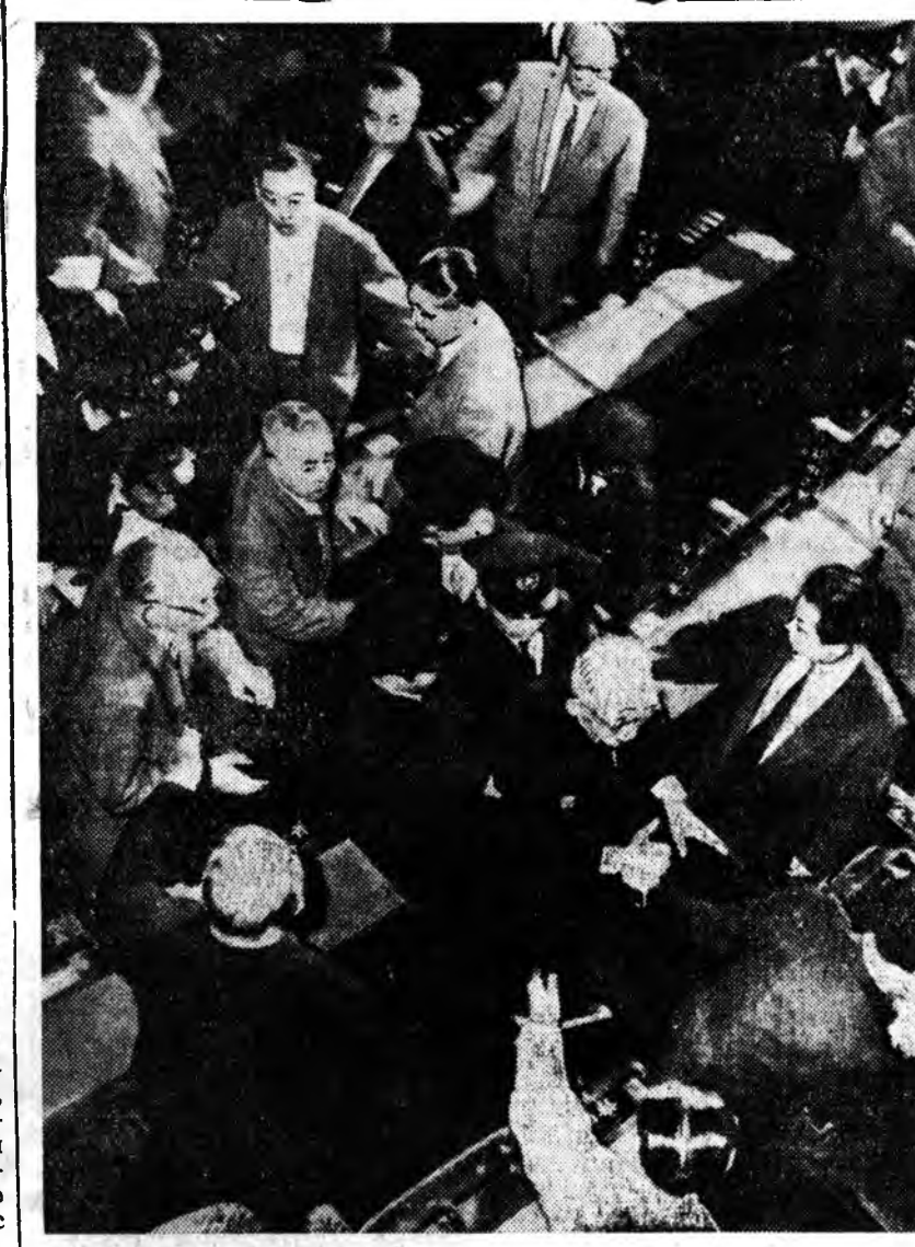
Парламентын доодо палатада. Палатын спикер Игнор Кийоэс харуул доро залһаа гаража абана.

дээрэ хэблэгдэжэ гараба. Политическэ литературын Румынгийн гүрэнэй хэблэл тэрэнь гарһан байна.