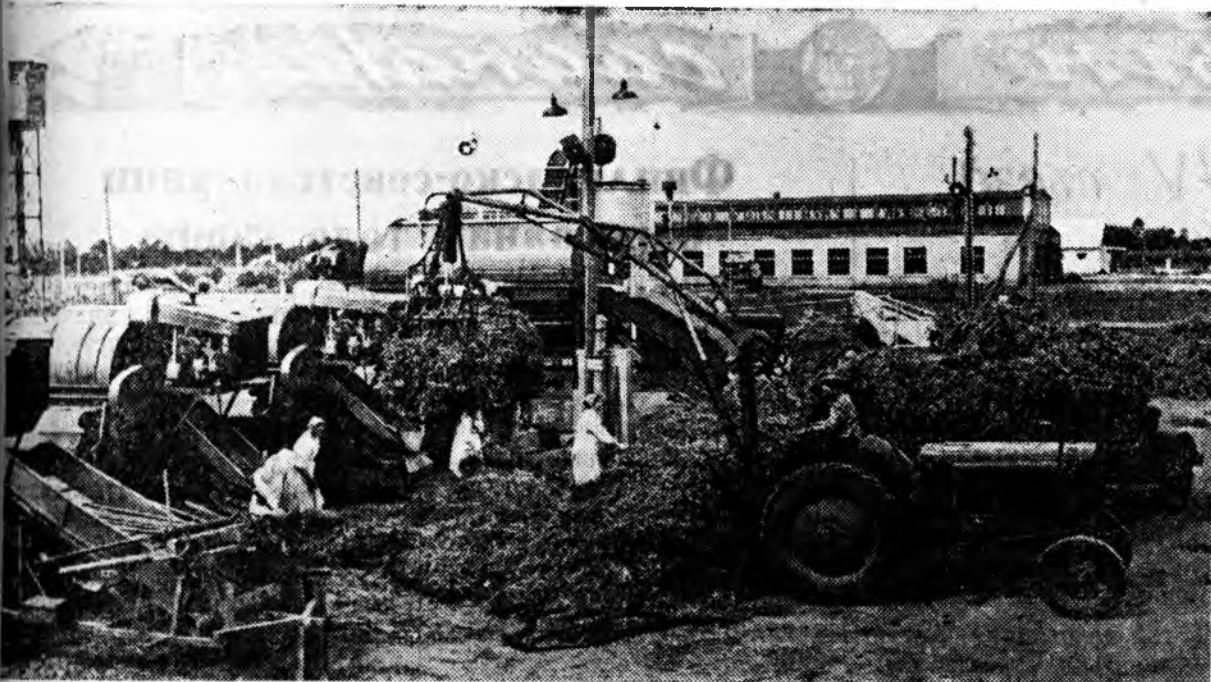
КРАСНОДАРАЙ ХИЗААР. Кубанийн колхоз, совхозууд ногоон горшкануудыг хуряаж эхлэл. Ново-Титаровска району «Россия» артельд гектары 30 дээшнэе центер урга хуралдана. Зураг дээр: «Россия» колхоздо ногоон горшкануудыг болбосуулжа байна.