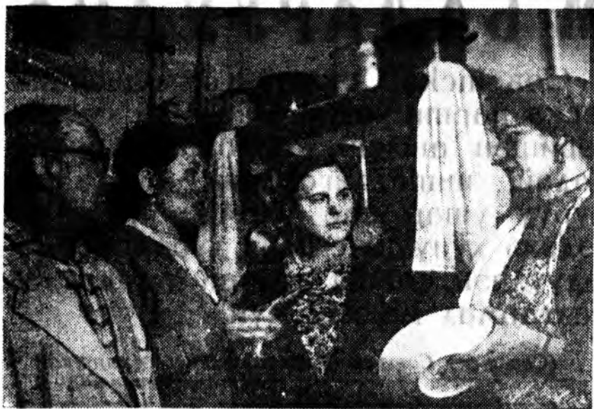
ЛЕНИНГРАД. Ленинград-та шэнээр баригдан уйлснүүдэй нэгэндэ, Краснопутиловска үйлсэд ажаһуугшад...

Найхан бөлгөхын түлөө тэндэхи үүсхэлшэд ехэ юумэ хэбэн байна. Тингэжэ богонхон болзор соо сээрлинг бин болгоһон, үхидүүдэй наадаха, сэнгэха газар аятай зохиодор түхээр-нэн юм. Тэндэ үхидүүд сугларжа, уран зохёолшод, хүгжэмшдтэй уулзадаг, найшаг тэндэхи улаан булангай гэртэ эхэнэрүүдэй хубсаһа наймаалха выставкэ нээгдэе. Гална тэндэхи хүнүүдэй гэртэнэ элдэб эдэе хоол абаашажа худалладаг болонхой.