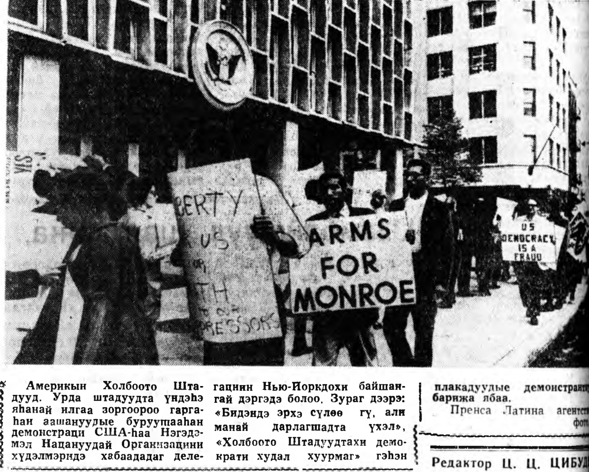
Америкын Холбоото Штаттуд Урда штаттудай үндэһэ яланай илгаа зоргоороо гарган аашануудые буруушаанан демонстраци США-наа Нэгэдэмэл Надаануудай Организацияни хүдэлмэридэ хабаадаг делегацин Нью-Йоркдох байшандугай дэргэдэ болоо. Зураг дээрэ: «Бидэндэ эрхэ сүлөө гү, али манай дарлашадта үхэл», «Холбоото Штаттудтай демократи худал хуурмаг» гэжэн плакатуудые демонстраци баржа лбаа. Пренса Латина агентствон Редактор Ц. Ц. ЦИБУЛ

ВАРШАВА, августын 14. (ТАСС). Варшавска Договортэ хабаадаг гүрэнүүдэй правительствонуудай мэдүүлгын ёһоор эб найрамдал хангаа, ГДР-ые, илангаа