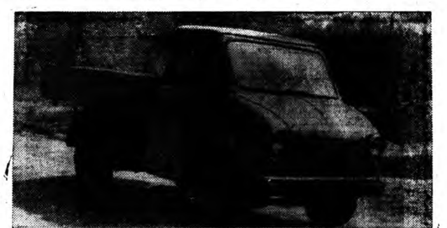
УКРАИНЫН ССР. «Коммунар» гэжэ Запорожско автоза-водто «ЗАЗ-940» тухэдэй ашаанай бага машина хэдгэдэ байна. Тэрэ машина оройдоо 700 килограмм шэгнүүртэй. Час соо 80—70 километр абаха юм. Зуун километр ябахадаа 8—9 килограмм бензин галдадаг. Хоёр хүн уугаад, 400 килограмм аша тээгээд ябаха.

Статья 22. Нүхэдэй сүүдтэ техникэ талары хангаха хэрэгтэ гэндхи предприятиин, эмхи зургаанай, организа-циин, байра ашагладаг кон-торын ба домоуправленинүү-дтэй алба захиргаан, мүн колхозуудай правленида, хү-дөөгэй ба поселогуудай ажал-шадтэй депутатудай Советэй гүйсэдхэхэ комитетүүдтэ даалгагдана.