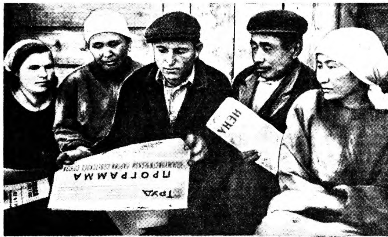
Манай республикын хүдэлмэришэд, алба хааг- шад Советскэ Союзай Коммунистическэ партийна Програмын проектые үргэһөөр зүбшэн хэлсэжэ байһа. Коммунистууд, партийнакөөһө хүнүүд энэ түүхэтэ документые зүбшөн хэлсэлгэдэ олоо- роо айхабтар эдбэхитэйгээр хабаадана.