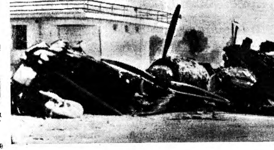
ЗУРАГ ДЭЭРЭ: тунисайн французска сэрэгэй самолет унагаагад байна. ТАСС-эй фотохроинико.

Жадио Куадросыс президентын тушаалһаа буулганан хархыс урбала эмхидхэгшэдэй ябуулгада арад зонгуаа эхээр эзбүүрхэн дүрагүйтэнэ. Рио-де-Жанейро нислэгтэй Гуанабара шатада бургуушаалтын бүгэдэнитын забастовка хэхэ гэжэ шиндхэгдээ. «Ороной хуули бусын ябуулга хэхэ замда оролгодо наад ушаруула» зорилгоор забастовка хэгдэхэн гэжэ профсоюзна организацинуудай хүдэлмэришгэд мэдүүлэе. Бүхы орон дотороо 100 мянга гаран студентнуудыс нэгдүүлгэ Бразилиин студентнуудэй национальна союз үсэгэлдэр бүгэдэнитын забастовка соносох. Нэримжтэй байхынь арадыс уриалһан манифестыс студентнууд тараһан байна.