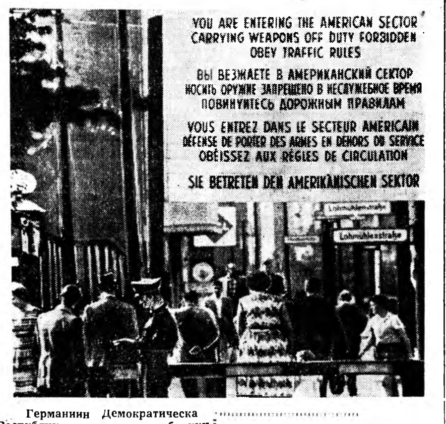
Германин Демократическа Республика пинсэлдэ баруун болон Демократическа Берлинэй хоорондох хил дээрэ 13 хилалтын пункт байгуулагданхай. Арадай полицин органуудай зүбшөөгүзһэн документүүдэй ёһоор эрхэтэд хилыс гараха шадаха байна. Зураг дээрэ: Баруун Берлин орохо пунктуальны ДЫН фото.

Дуугаа үгэлгэ тухай лэхэдэ, Америкын туйл Стивенсон Аюулгүйн резолюциян дүүргэлтэ доогүй байһыс «шаналаана» элрхэйлэн Холбоото Штадуудтай талһан хараа бодол түүлжэ шадахай байдалаа, Тунис Франци хоорондохи амгалан хэлсээ тус резолюция хэбэртэйгээр түбэгшөө рнээ Америкын делегациаа барива гэнэн нгаар тэрэ мэдүүлэе. Тэрэ Азинн орунуудай даһан резолюция хадаа Франци хоёр ой хооронд хэхэ тухай, Аюулсвэдэй резолюция болгохо эрилтэ хэлхэ бишуу.