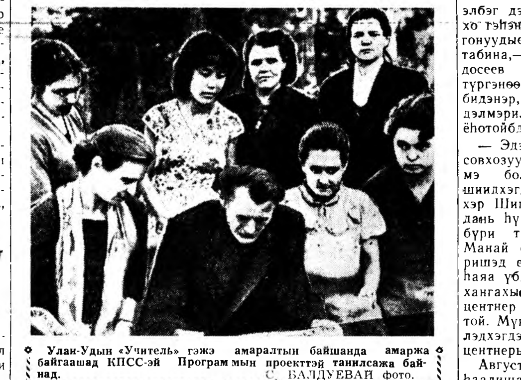
Улан-Удын «Учитель» гэжэ амаралтын байшанда амаржа байшагшад КПСС-эй Програмын проектэй танилсажа байһаан.

Коммунизм байгуулагшын ёһо заншал тухай хөөрөлдэхэ дуураа, Октябрьска районы партиина конференциин делегатууд Социалист Ажалай Герой Филиппова, Калинин, Бабушкина гэгшэд—партиина журм эбидэг, архи будаа, хальхай ябадал гаргадаг коммунистуудые партианаан гаригаха гэжэ Уставай проект дотор бэшэхэ шухала гэб.