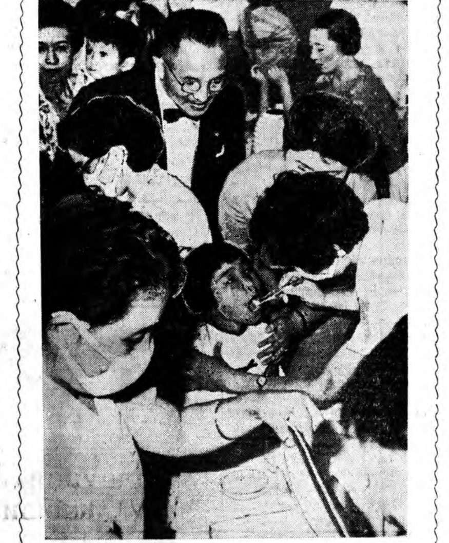
Япондо энэ зун мянга гаран хүн полициинилит үбшөөр үдөө гэжэ бүридхэлдэ абтаһан байгаа. Тэдэнэй хэдэн арбаадын үхэлэн байна. Олонитын баалагшаар Японной правительство Советскэ Союзһаа 10 миллион доз вакцина худалдажа абаа. Зүрэг дээрэ: Токиогой үхүүд полициинилит үбшөөр хэрүүлхэ советскэ вакцинны хүргэжэ байна.

БЕРЛИН, августын 27. (ТАСС). Баруун болон демократическэ Берлинэй хоорондохи хил дээрэ августын 26-най үдэш шэнэ хорото ааша гаргагдаба. АДН агентствын мэдээсэлэһэнэй ёһоор арадай полициин бүлэг алба хэгшэ-