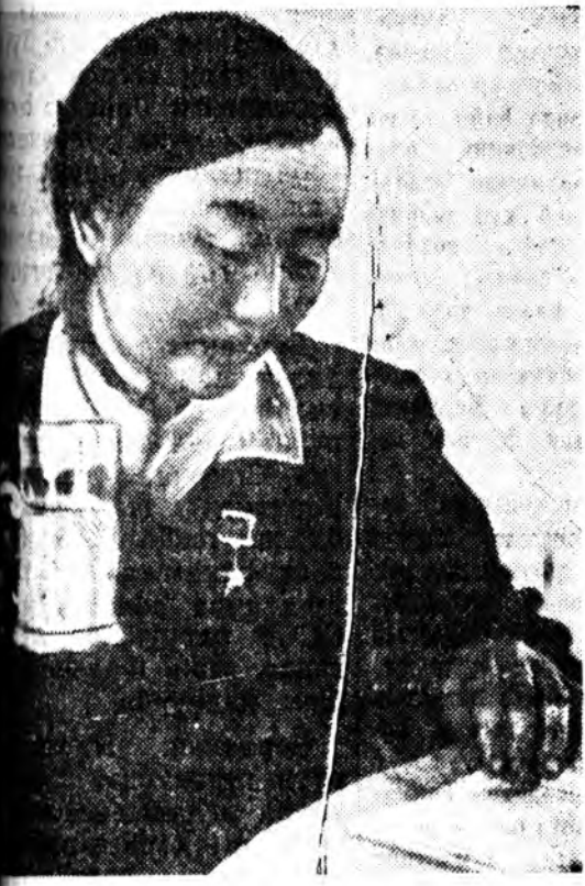
Ээй Устав—манай партиин эмхидхэ- лдье найжаруулаха хурса эзбэг мүн. Уставай проект ажабайдалай эрилтэ

нистуудай зүгһөө ехэ ханамжатайгаар угтагдаа. Тэрэ халаа партийна ажабайдалай ленинскэ ёһо гуримы хазгайруулангүй са- хиха, хамтаараа удардалгын ёһо гуримы партийна органууд, тэрэнэй хүдэлмэришэдэй партийна олонитын урда харюусалгатай байл- гые, коммунистуудай эдэбхи зоригы сааша- дань дээшлүүлхэ хэрэгы хангана.