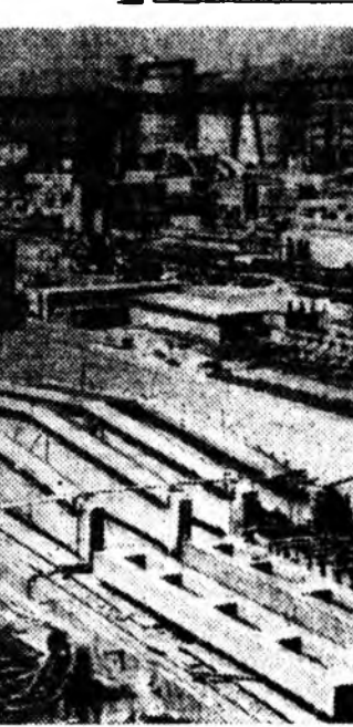
БОЛГАРИН АРАДАЙ РЕСПУБЛИКА. Софи шадарай Кремиковска Болгаридан тон барилгажа байхай, Комбинатай барилга энэ табан жэлдэ дүүргэгдээ юм. Энэ томо барилгы Болгарин комсомол шефтээ абанхай. Зураг дээрэ: комбинатай барилга.

Социалистическэ гүрэнэй зүгһөө эмхидхэгдэдэг, тусбэй ёһоор хүтэлбэрлэгдэдэг зохион байгуулхы сүлөөтэ ажал, хүдэлмэрийн ангиин, техническа интеллигенциин, хүдөөтэй ажалшадай, наука, культурын бүхэдэмрилгөшэдэй эршэ зориг байгууламнай арбадхана, манай оройной хүсэ шадал бэхийжүүлнэ. 1960 ондо