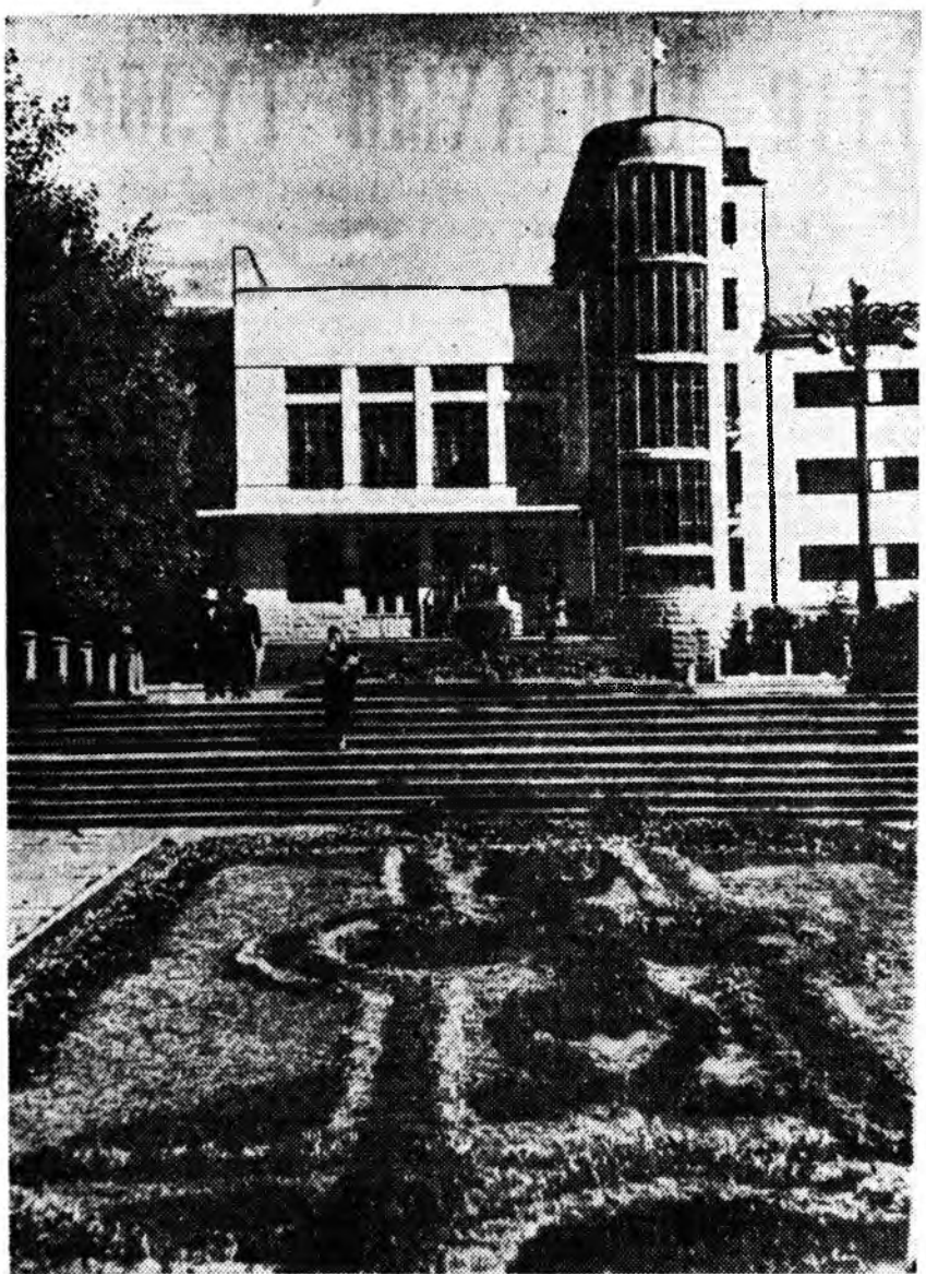
УЛАН-УДЭ, СОВЕДУУДЭЙ БАЙШАН.