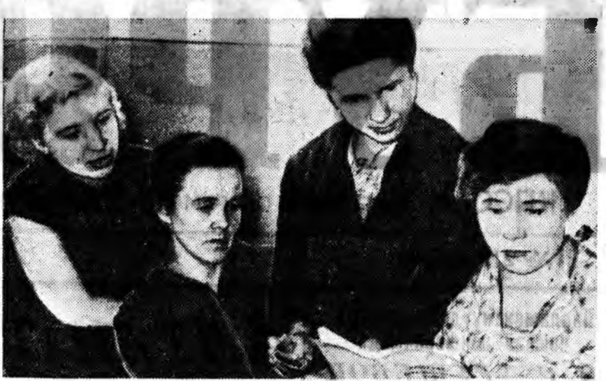
Эдэ үдэрнүүдтэ Улан-Удын Э-дахин хүүгэдэй садай коллектив КПСС-эй Программын проектэй угаа йонирхон танилсана.

Агитаторуудай сентябрь парадда КПСС-эй Программын проектээр хээ лекци, элидхэл болон хөөрөөдөөнүүдэй жэшээтэ тэмэнүүд блокнодой хуулын хуудананда толилогдонхой.