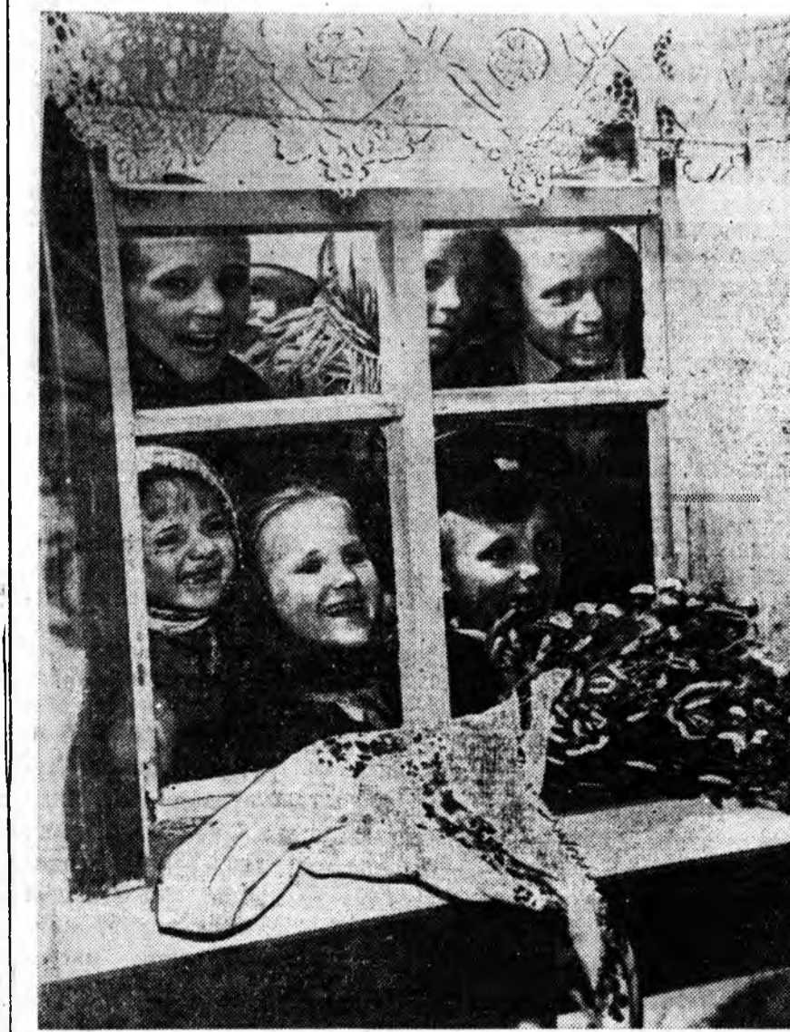
Уран найханы фото-зурагай уласхоориды Московско выстэвкэ. Зураг дээрэ: «Хүдөөгэй тур».