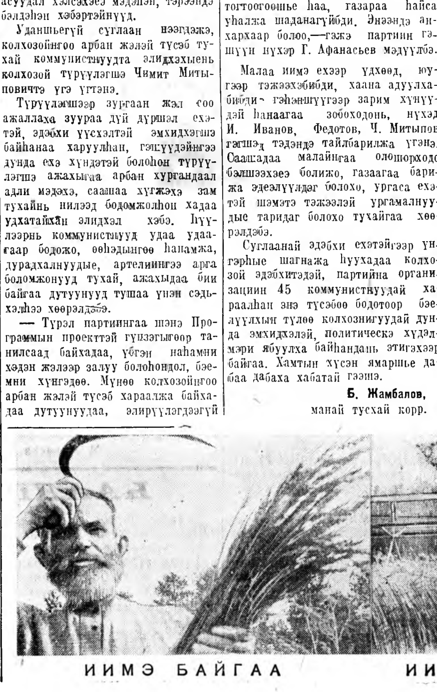
ИИМЭ БАЙГАА ИИМЭ БОЛОО