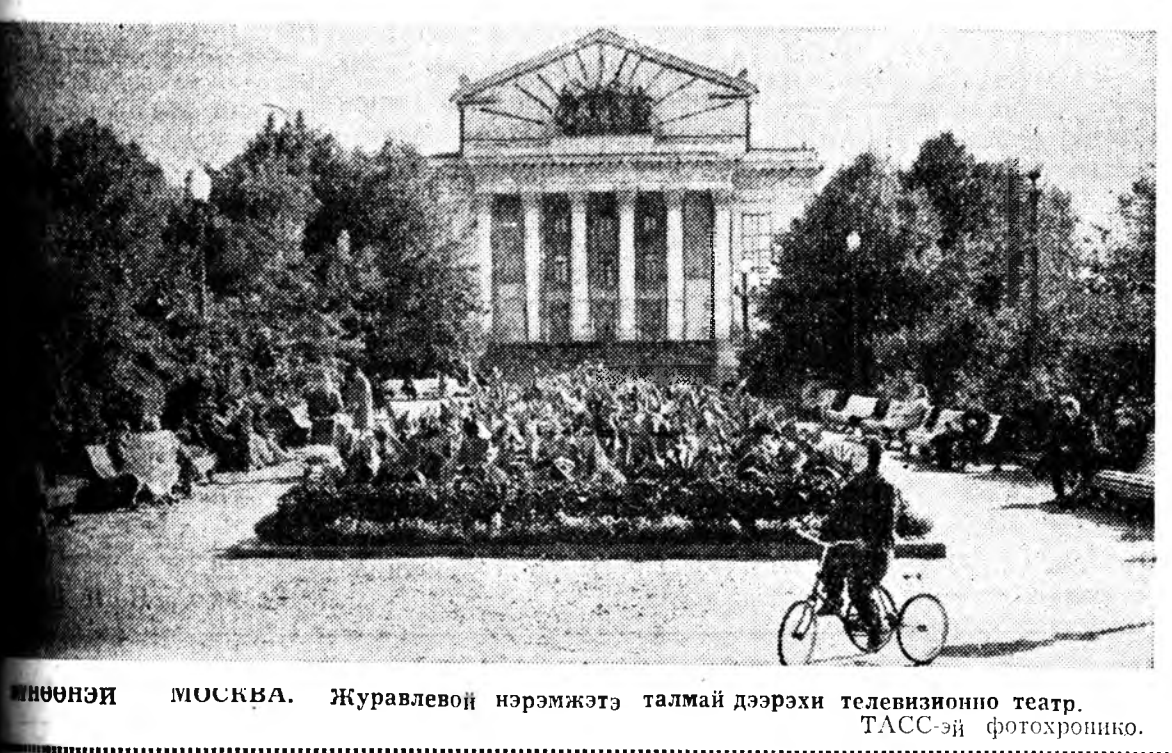
МОНГОН МУСКВА. Журавлеовой нэрэмжэтэ талмай дээрхи телевизионно театр. ТАСС-эй фотохронико.

Одоо гүрэнүүдэй дотоолын хэрэгтэ оролсохогүй, аб найрамдалда дуратай политика Советскэ Союз ябууддаг. Харин тийхэндэ бусад ороноудта социалистическэ революци хүсөөр тараахые Советскэ Союз оролодо гэжэ коммунизмда эсэргүү хүнүүд номнодог.