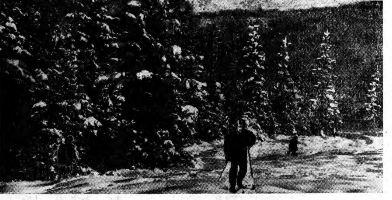
Ундэр уулын орой сэмхэгтэн, сэгэн хүүхэ тэнгэртэй хаяган нийлэнэ. Санаша хурдан хуурун саһа һэтэ зуран, түрүүшын харгы гаргана.