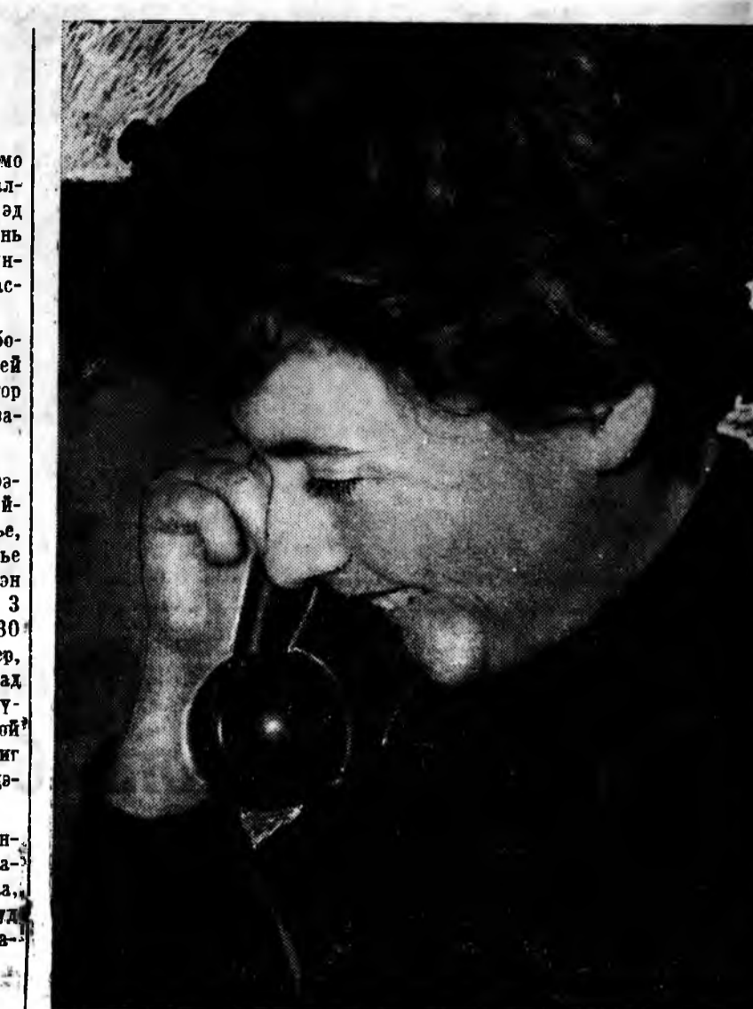
ШЭНЭ-ЖЭЛЭЭР АМАРШАТНАБ!