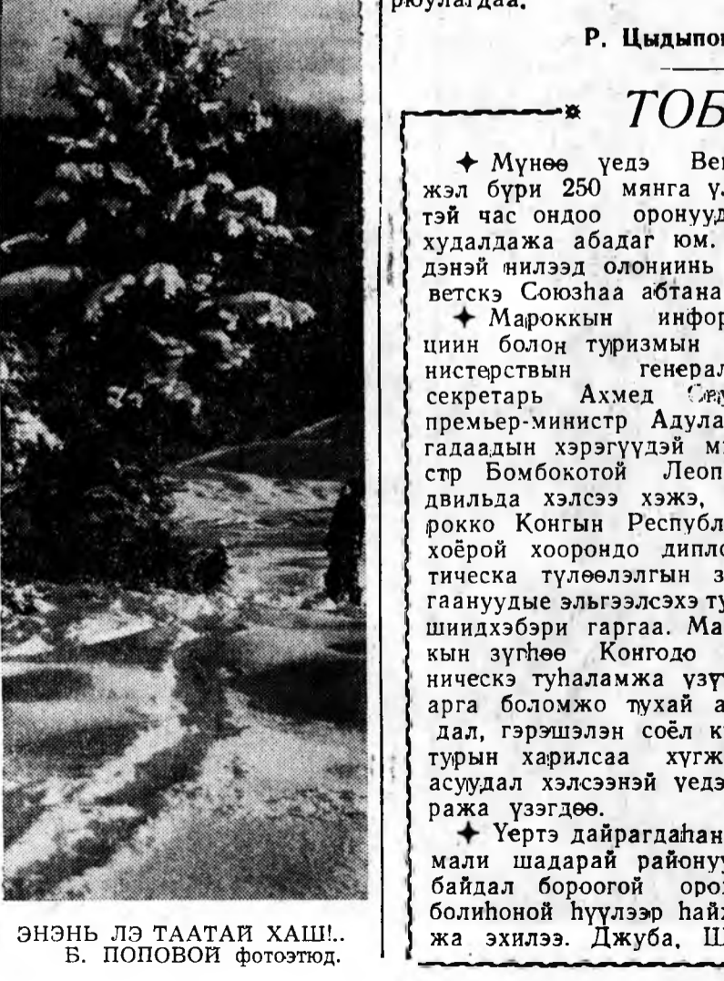
ЭНЭНЬ ЛЭ ТААТАЙ ХАШ...

бэрхэ шатаршан Сампилов Мантыковые удаан болгонгүй шүүжэ, зоотехникескэ факуль- теттэ тон шуухала очко асар- на. Хоёрдохой хюлгэ дээрэ наа- даһан үнинеи шатаршан Ма- миллов арбан юндэхин ябадал- даа алдуу хэжэ шүүгдэшбэ. Тинишье бэшэ шатаршаднын һайнаар наадажа, 13,7 гэһэн тоотойгоор нүгөөдүүлэ шүү- бэ. Технологиуд ветеринарнуудые 10,5:9,5 гэһэн тоотойгоор шүүгээ. Тигэжэ зоотехниче- ска факультетэдэйд хамтадаа 49 очко абажа, институтай чемпион болобо. 45 очко аба- һан технологическа факультет хөөрдохой, 38 очко абаһан ве- теринарна факультетэдэйд гурбадахы һуури эзэлбэ. Тү- рүүшын гурбан һуури эзэлһэн факультетүүдтэ грамота ба- роулагдаа. Р. Цыдыпов.