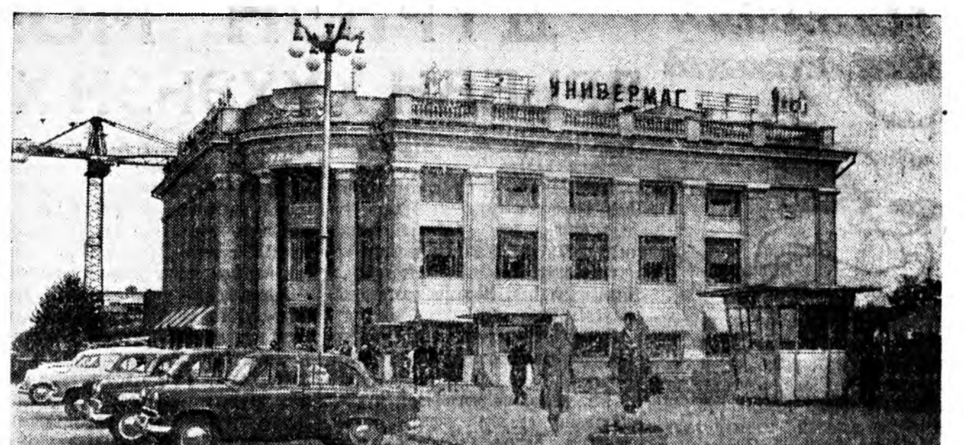
КАВАРДИНО-БАЛКАРИН АССР. Нальчик городто шэнэ университет хаяхан нээгдэ. Эндэ худалдаа наймаа эрхилхэ түрүү арга онолнууд үргэнөөр хэрэглэгдэнэ. Республикын эгзэн томо магазиннай хүдэлмэрилгэгшэд түрүүшын үдэрнүүдхээ эхилэн эд бараанай эрьсын түсэбне үлүүлэн дүүргэнэ. Зураг дээрэ: шэнэ универмагай юрэнхы түхэл.

Нэн түрүүн квадратно-гнездовой аргаар тарихада, нэгэ нүхэндэ лаб 3—4 эшын байхаар тоотой үрһэн тариха шуухала. Тэрэнхээ олон хаа буурсагынь ёһоор габахгүй бшуу. Гадна буурсаглуулжа абаха кукурузы мун хурьяагаад, силос дарайдаг орходоо нэгэ неделээр урид тариха ёһотой. Илангаяа эртэ хоруу ундааг газарта энээнине найса караада абаха байна. Тийхэдэ ургасын элдэв хорхой