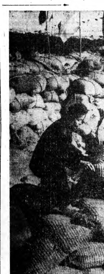
Корейн Арадай Демократическа Республикын хүдөө ажахын кооперативуудта жэлэй дүнгүүд гаргагдана, олоо хубарилда болоно. 1961 ондо 1960 онойхидо ороодо 1 миллион тононо ехэ орооно тарьяан абтанхай. Зураг дээрэ: Лион (Ихенянай район) гэжэ хүдөө ажахын кооперативта олоо хубарилда боложо байна. Ажалша бүхэн дунда ээргээр тус бүридөө 3 тоноо орооно, 1100 вон (багсааһада 825 түхэриг) мүнэ абһан байна.

ЛОНДОН, январин 5. (ТАСС). Газарай магнитна талмайда болохо хубилалтануудые хэрэглэн газар доро хэгдэлэг ядрна тэһэрэлгэнүүдые мэдэхэ һайн арга Англиин эрдэмтэд шэнжэлэн олобо гэжэ «Ивнинг Ньюс» гэдэг Англиин газетын научна шэнжэлэгшэ мэдээсэ.